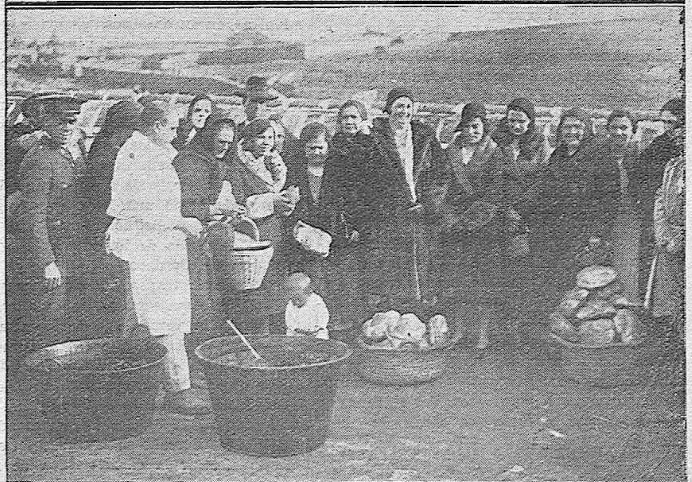
VILLANUEVA DE CORDOBA.—Entusiasta recibimiento tributado en dicho pueblo a las autoridades cordobesas que asistieron a la inauguración del Matadero Municipal.—Distinguidas damas cordobesas y de aquella villa, presenciando el reparto de comida con que fueron obsequiados los pobres.