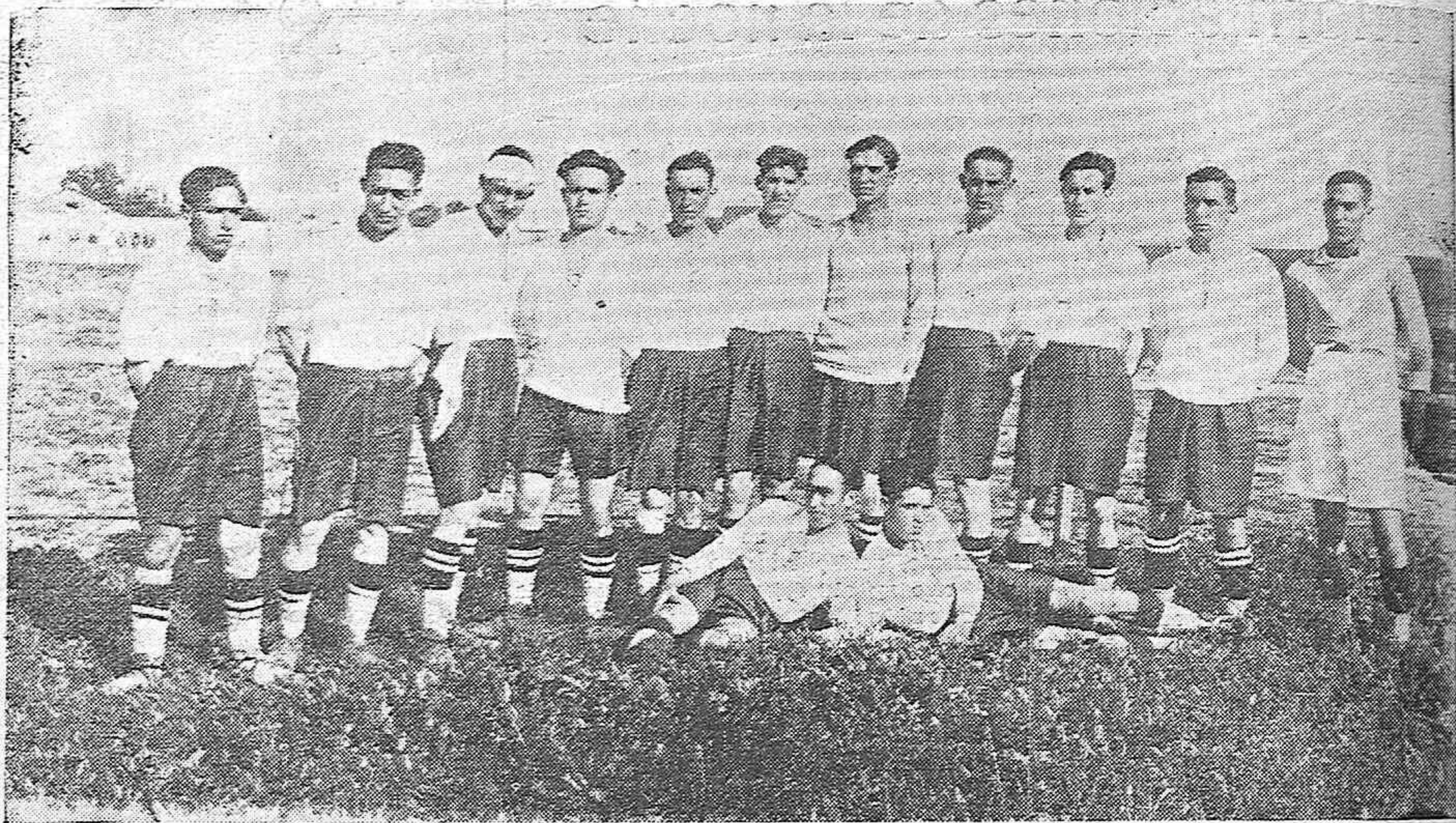
EL NUEVO EQUIPO UNIÓN DEPORTIVA FERROVIARIA, QUE JUGÓ POR VEZ PRIMERA EN LA INAUGURACIÓN DEL CAMPO DEL R. S. C.