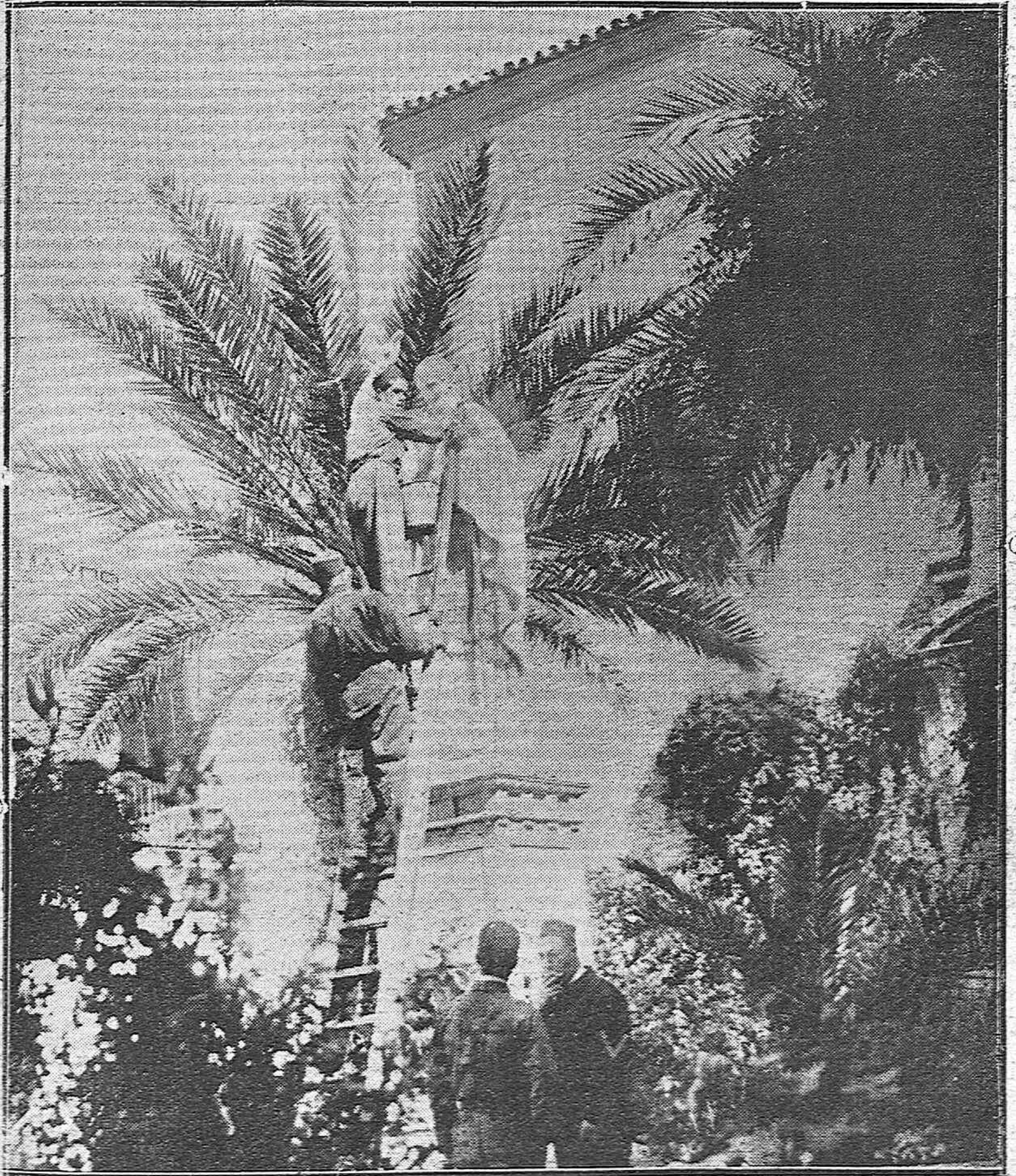
DEL SUCESO DE HOY. — UNA SECCIÓN DE BOMBEROS LIMPIANDO LA ESTATUA DE OSIO DE LA TINTA CON QUE APARECIÓ MANCHADA ESTA MAÑANA.