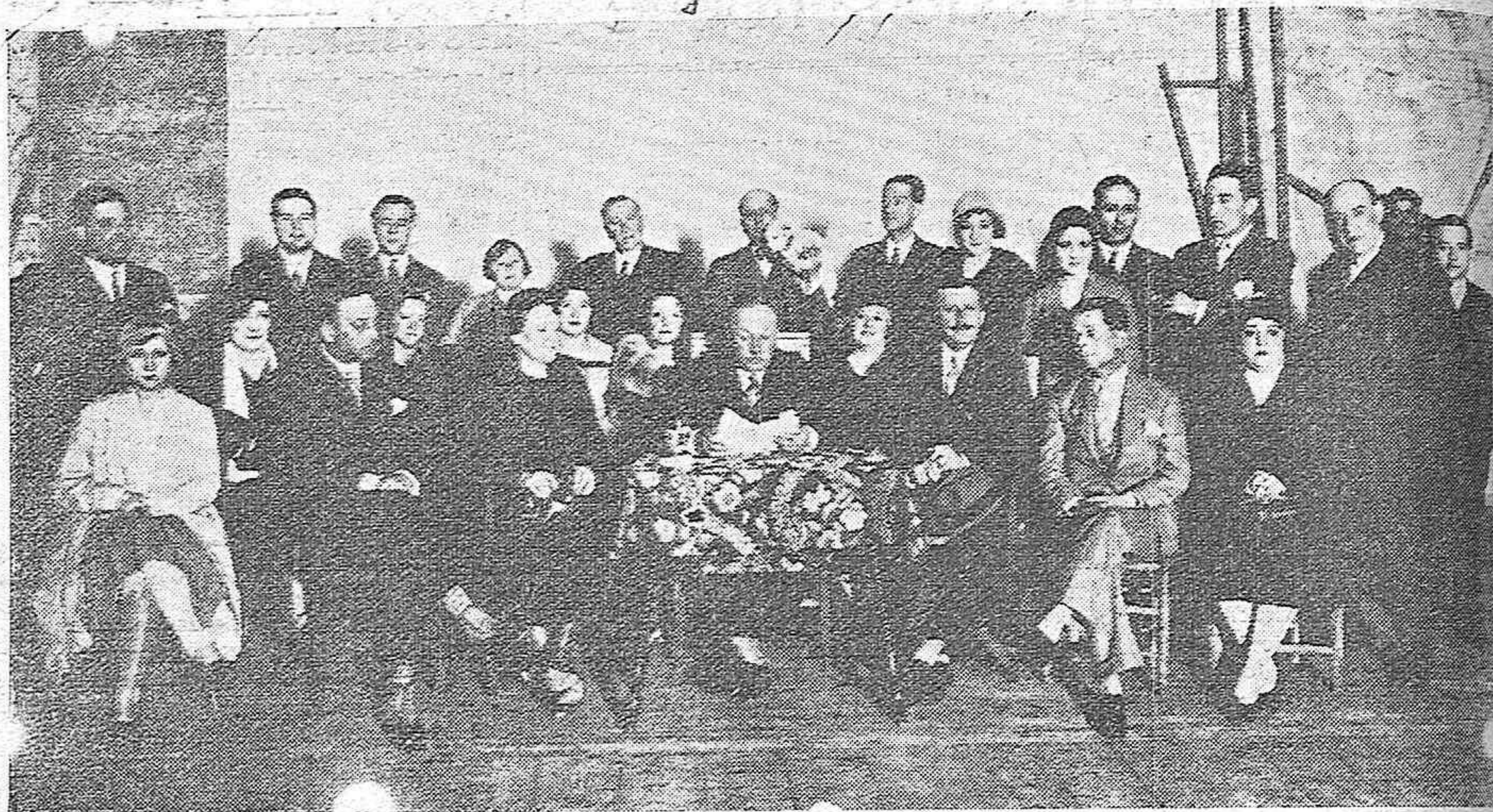
SEVILLA.—LOS INSIGNES SAINETEROS HERMANOS QUINTERO LEYENDO SU COMEDIA «LOS BUENOS DE SEVILLA» A LA COMPAÑIA DE IRENE ALBA, QUE EN BREVE DEBUTARÁ EN EL DUQUE DE RIVAS.