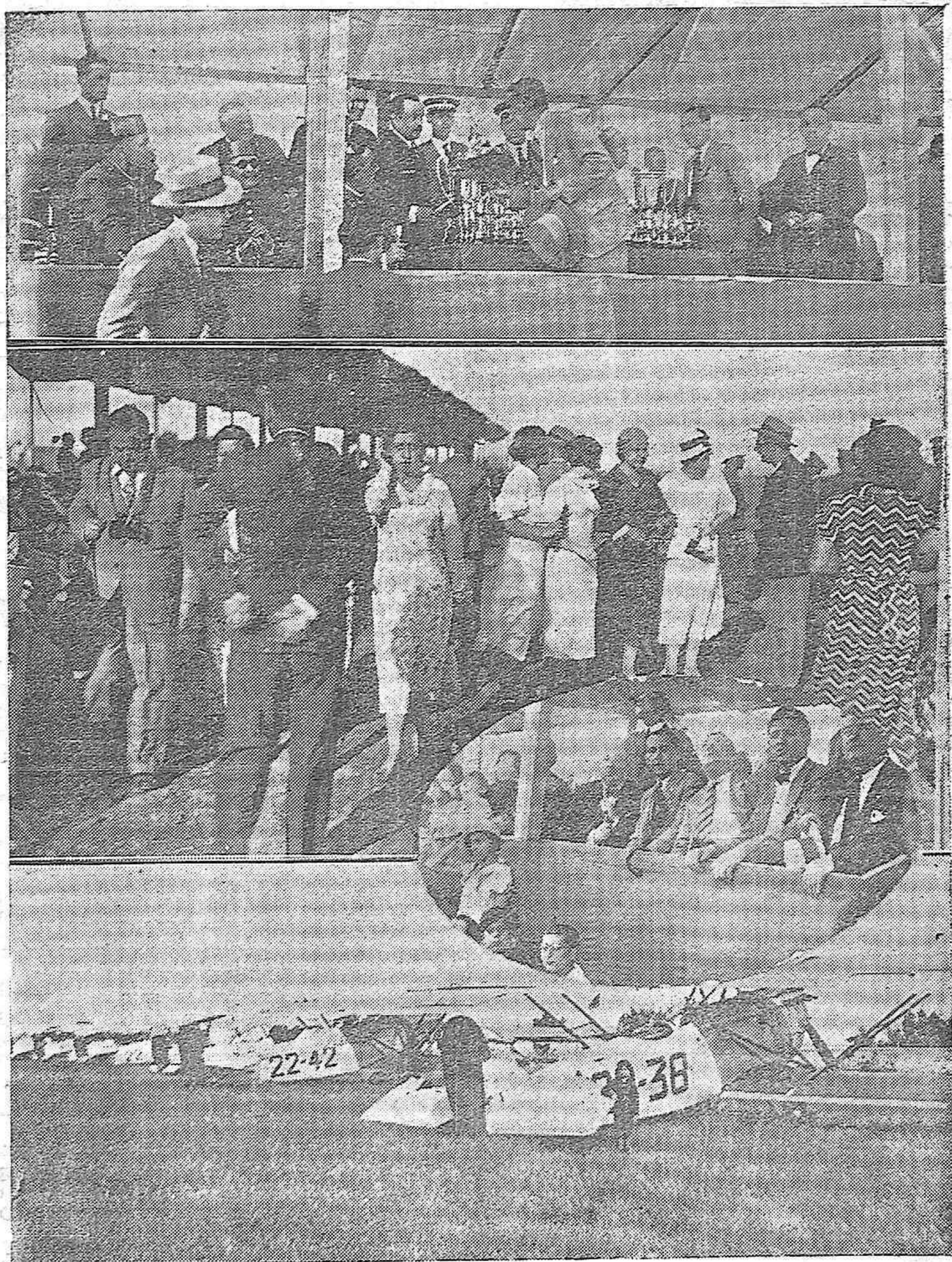
ACTUALIDAD GRAFICA.—Varios momentos de la gran prueba de Aviación efectuada ayer en el Campo de la Electromecánica