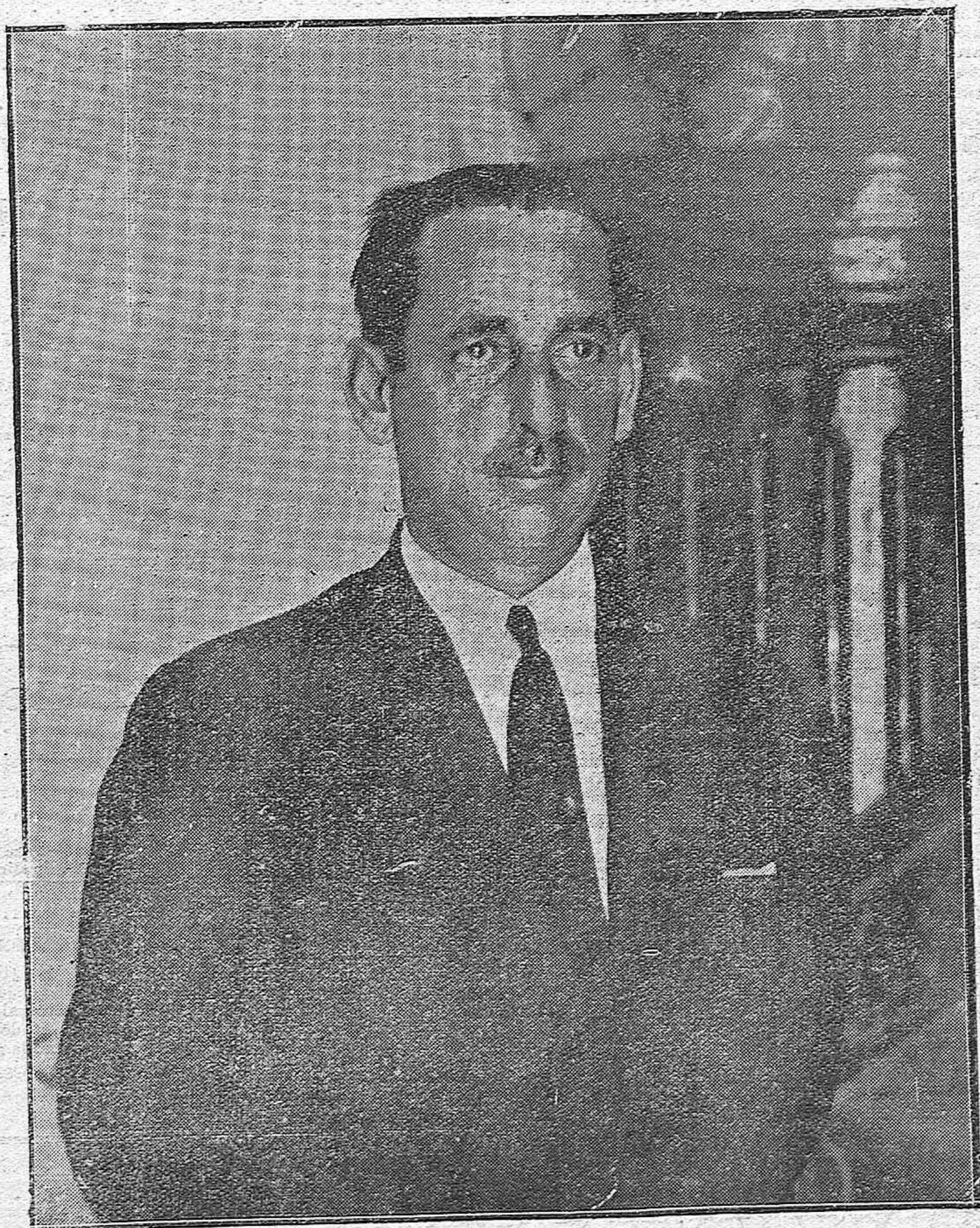
El nuevo Alcalde de Córdoba, D. José Sanz Noguera