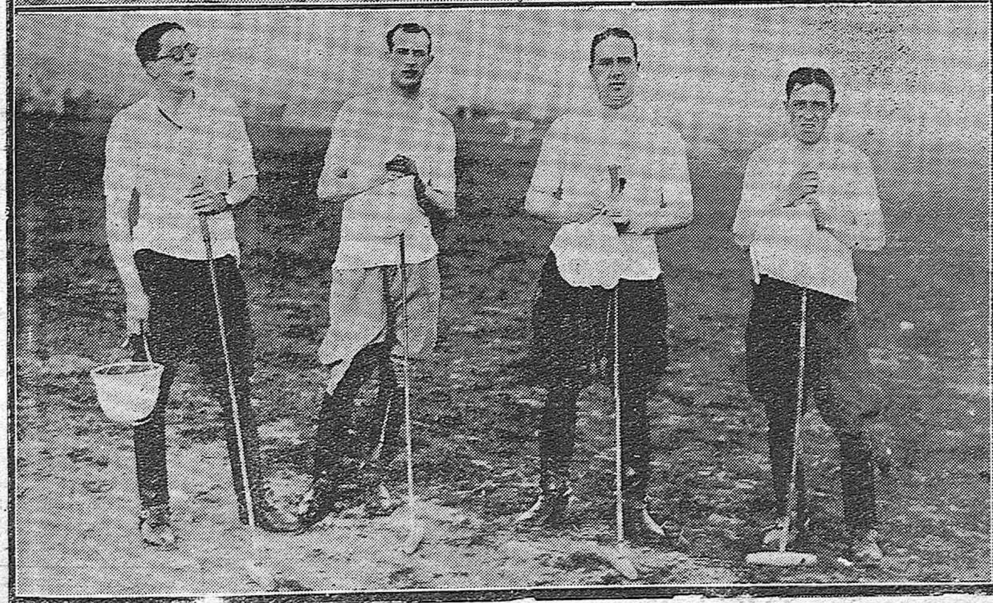
EL "POLO" MILITAR.—Los equipos del regimiento de Lanceros de Sagunto, que efectúan pruebas de entrenamiento para la selección del que irá a Jerez para contender en el Campeonato regional..