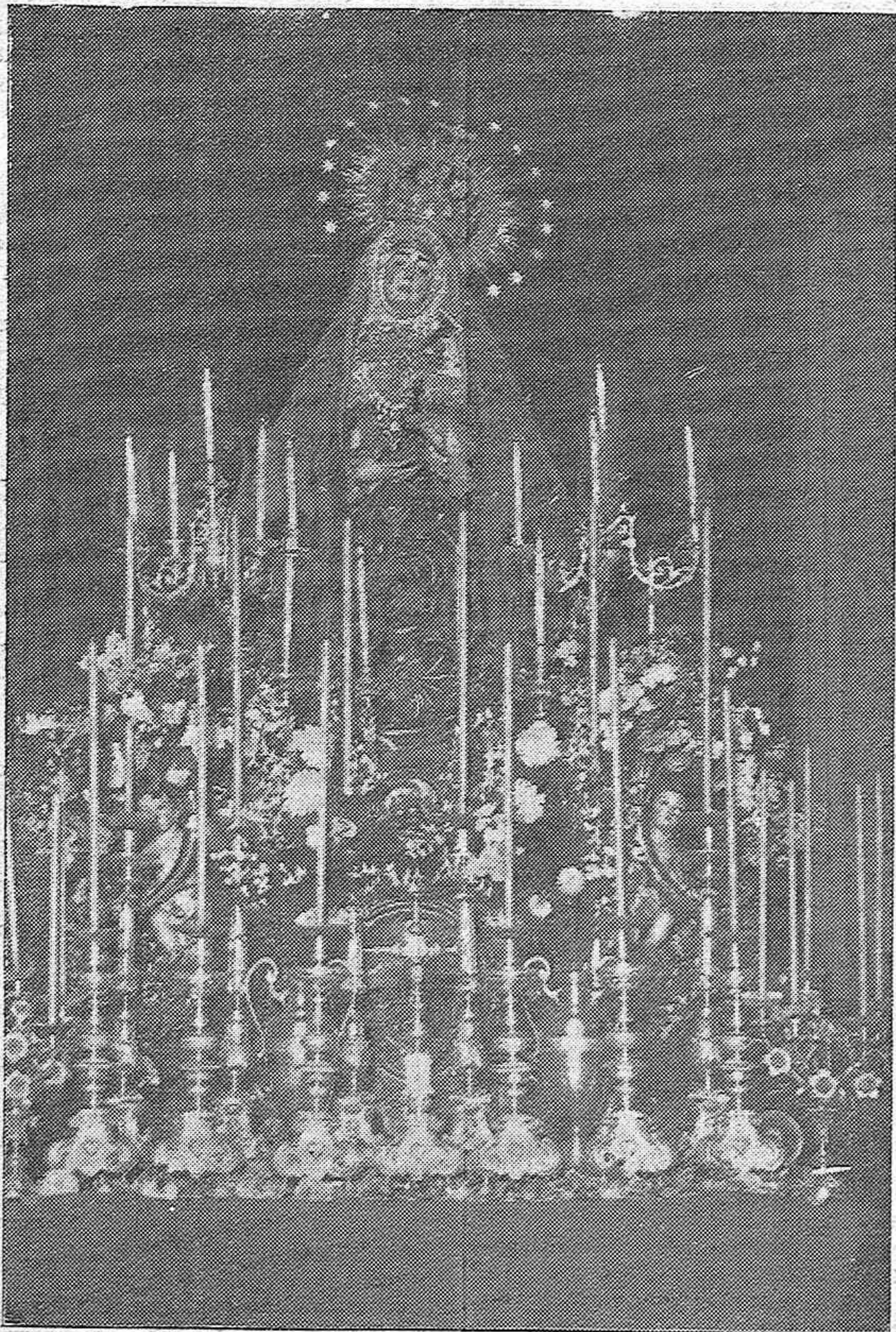
SEMANA SANTA.—Bellísima Imagen de Nuestra Señora de los Dolores, que figurará en la procesión del Santo Entierro.

La hermandad de Nuestra Señora de los Dolores cuenta en la actualidad con más de dos mil cofrades, de los que acompañan a la Virgen vestidos con túnicas en la procesión del Viernes Santo, unos ochocientos.