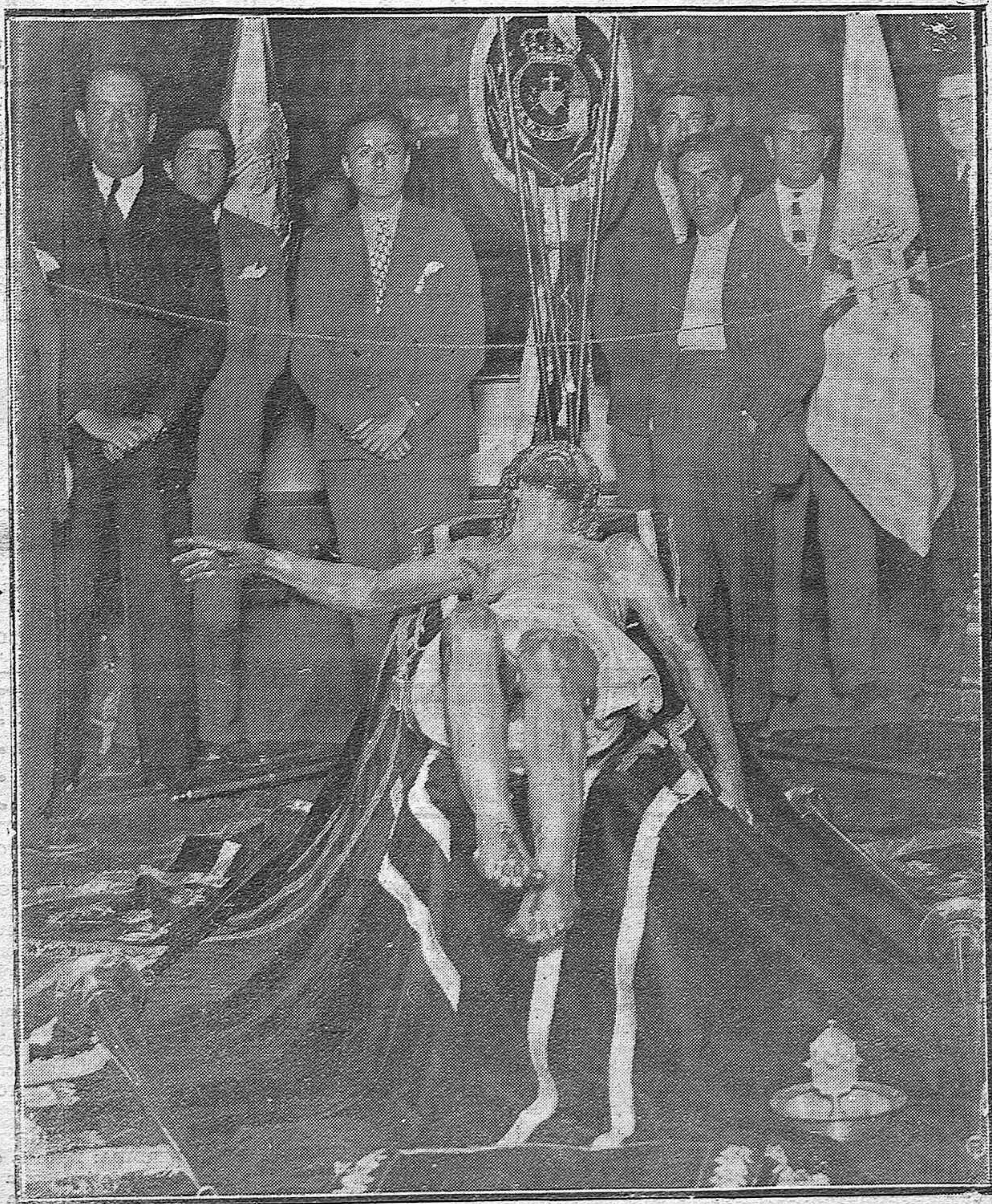
EN LA IGLESIA DE SAN AGUSTIN.—Acto del B. L. P. a la Sagrada Efigie del Santísimo Cristo, organizado por la Cofradía de Nuestra Señora de las Angustias