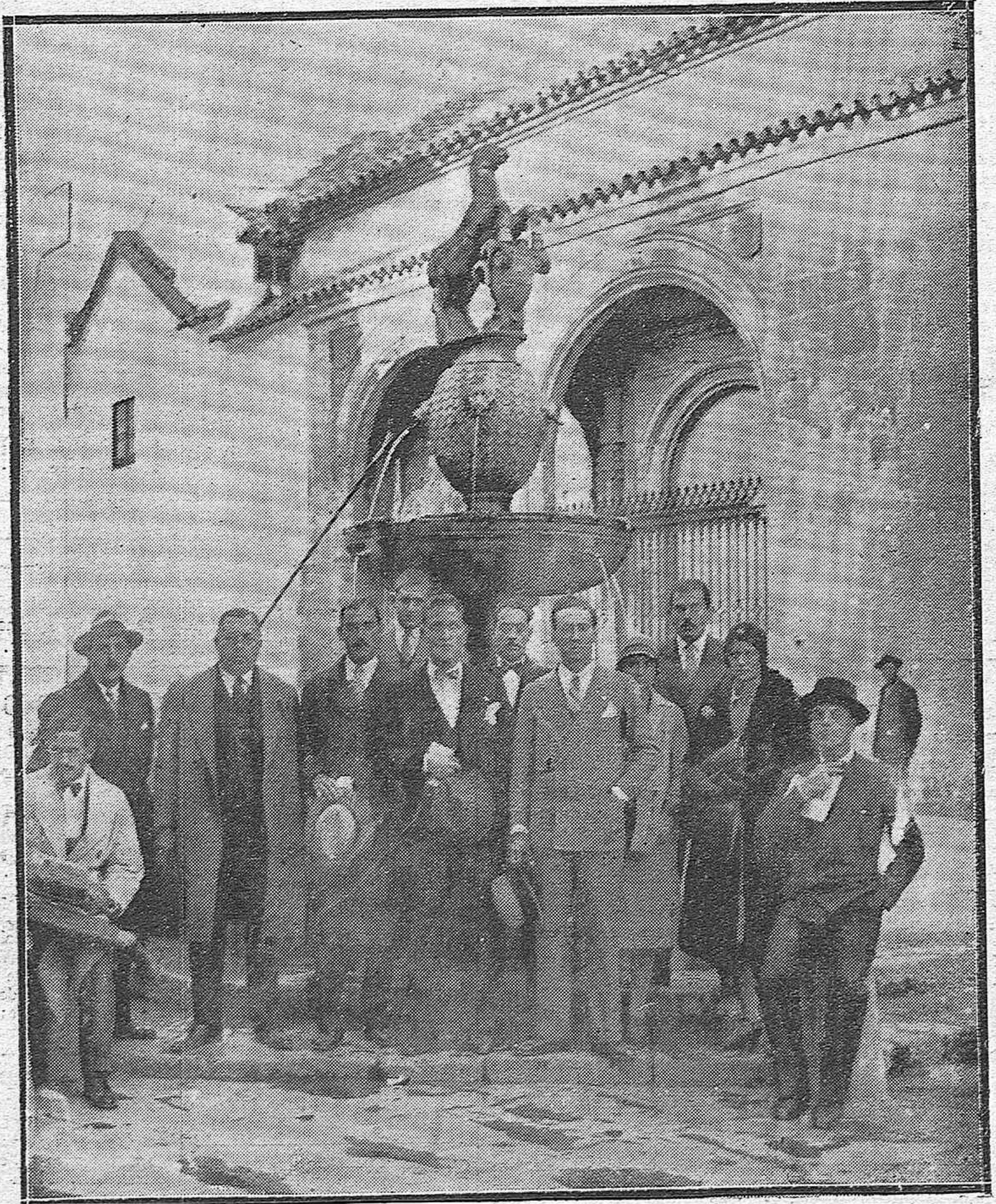
ESTUDIANTES EXTRANJEROS EN CORDOBA.—ALUMNOS DE LA ESCUELA DE AGRICULTURA DE BUENOS AIRES, QUE LLEGARON A NUESTRA CAPITAL EN VIAJE DE ESTUDIO.