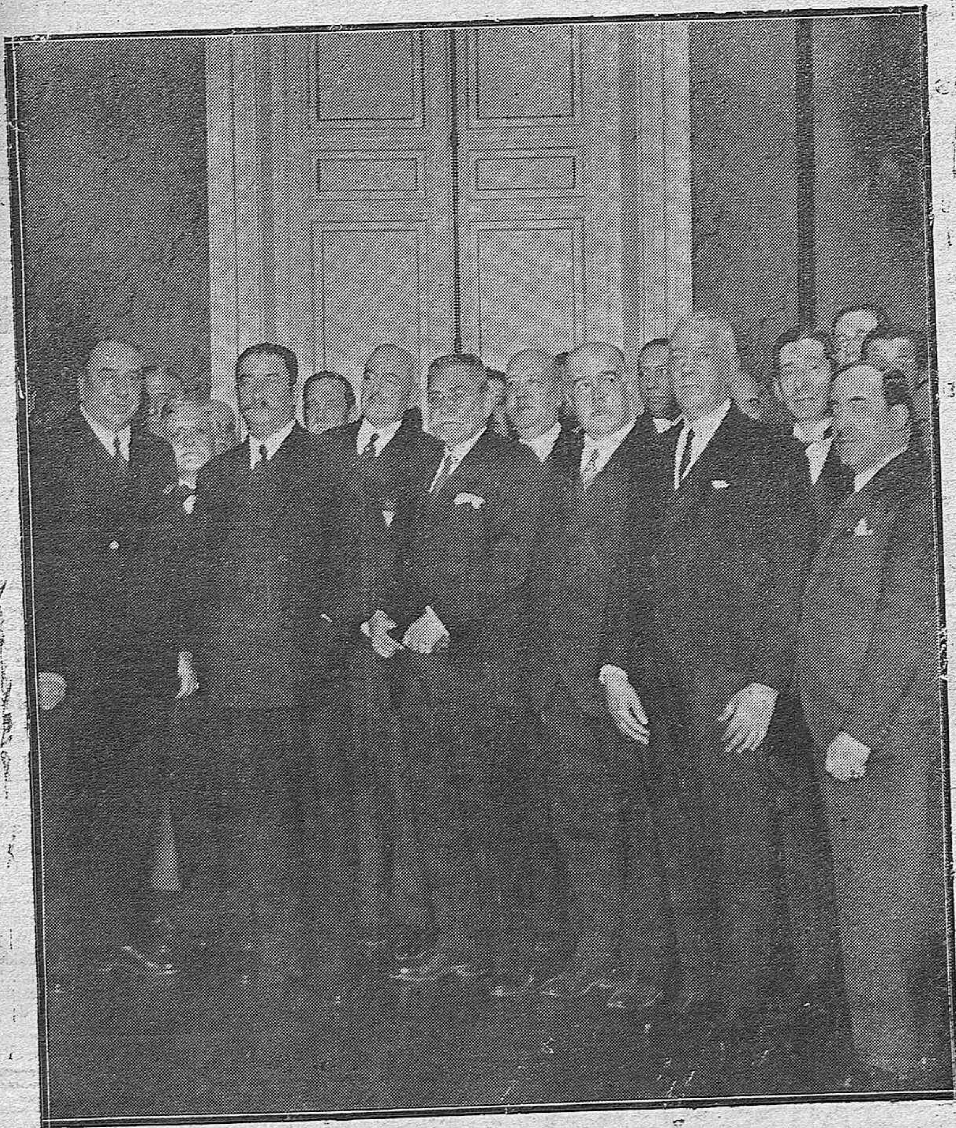
EL PRESIDENTE DEL CONSEJO DE MINISTROS, GENERAL BERENGUER, CON EL MINISTRO DE LA GOBERNACIÓN Y LOS NUEVOS GOBERNADORES, ENTRE LOS CUALES SE ENCUENTRA EL DE CÓRDOBA (X) SEÑOR ATIENZA.