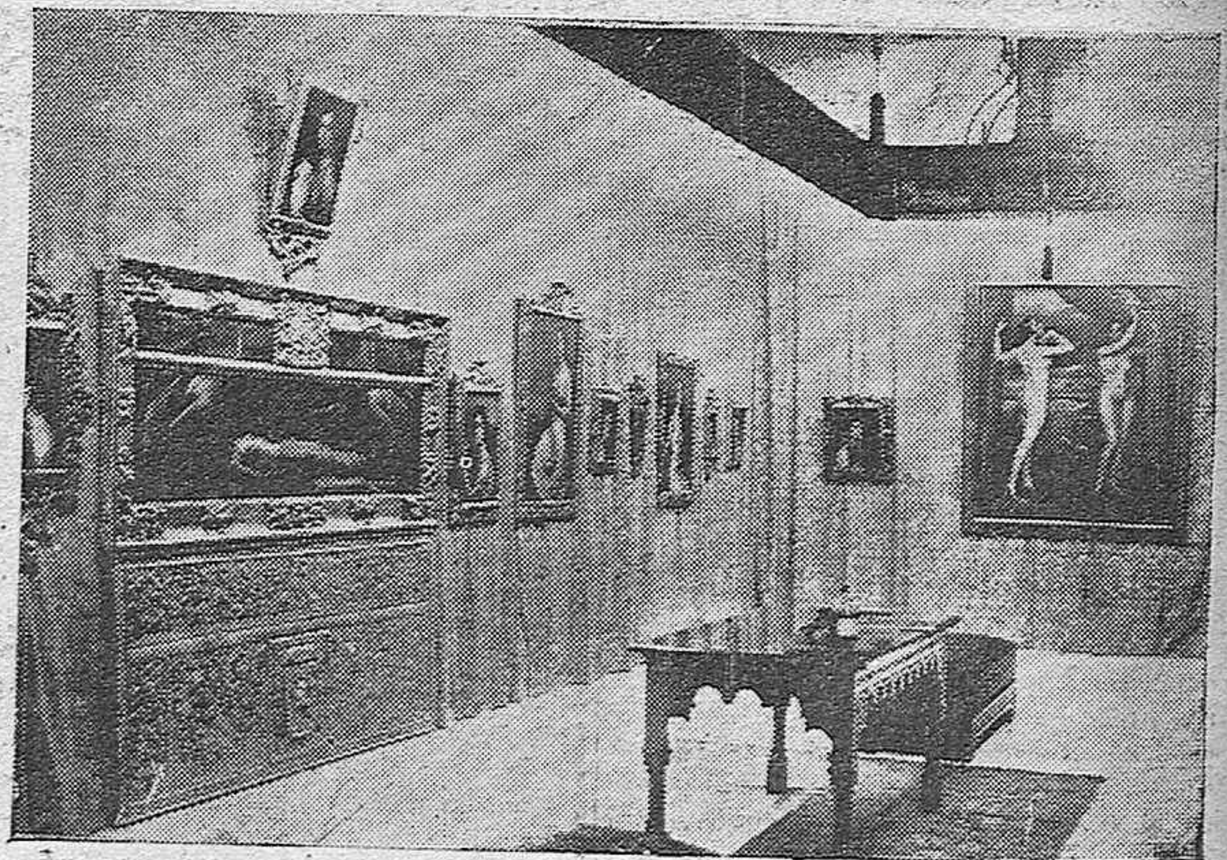
LA CASA DE CÓRDOBA EN LA EXPOSICION DE SEVILLA.—SALA DE ROMERO DE TORRES QUE ES OBJETO DE UNANIMIS ELOGIOS.