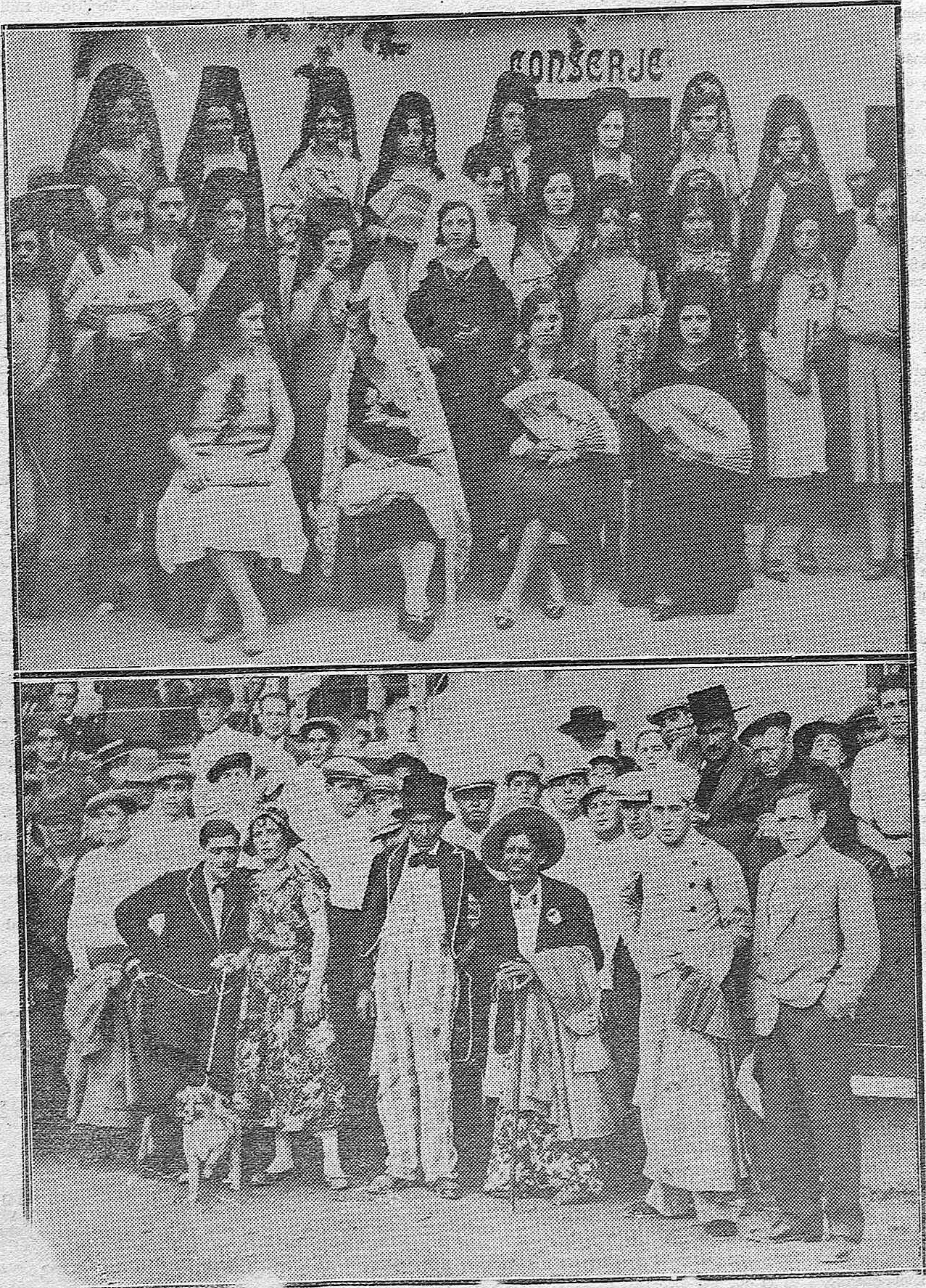
Señoritas que presidieron el espectáculo taurino-benéfico.—Las cuadrillas serio-bu fas que hicieron las delicias del público