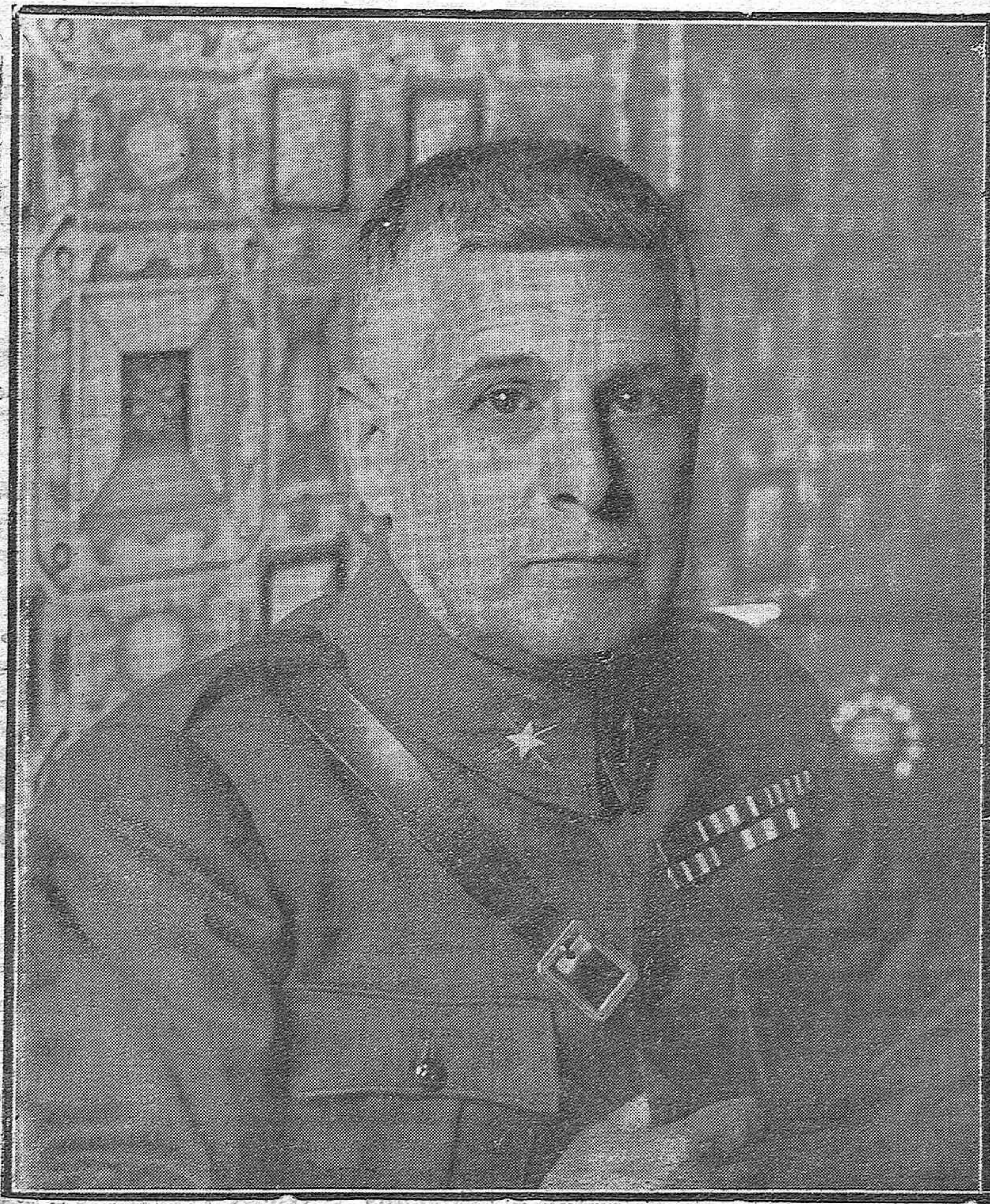
El nuevo gobernador militar de la plaza y provincia, general don Félix O'Shea, que recientemente se posesionó del mando