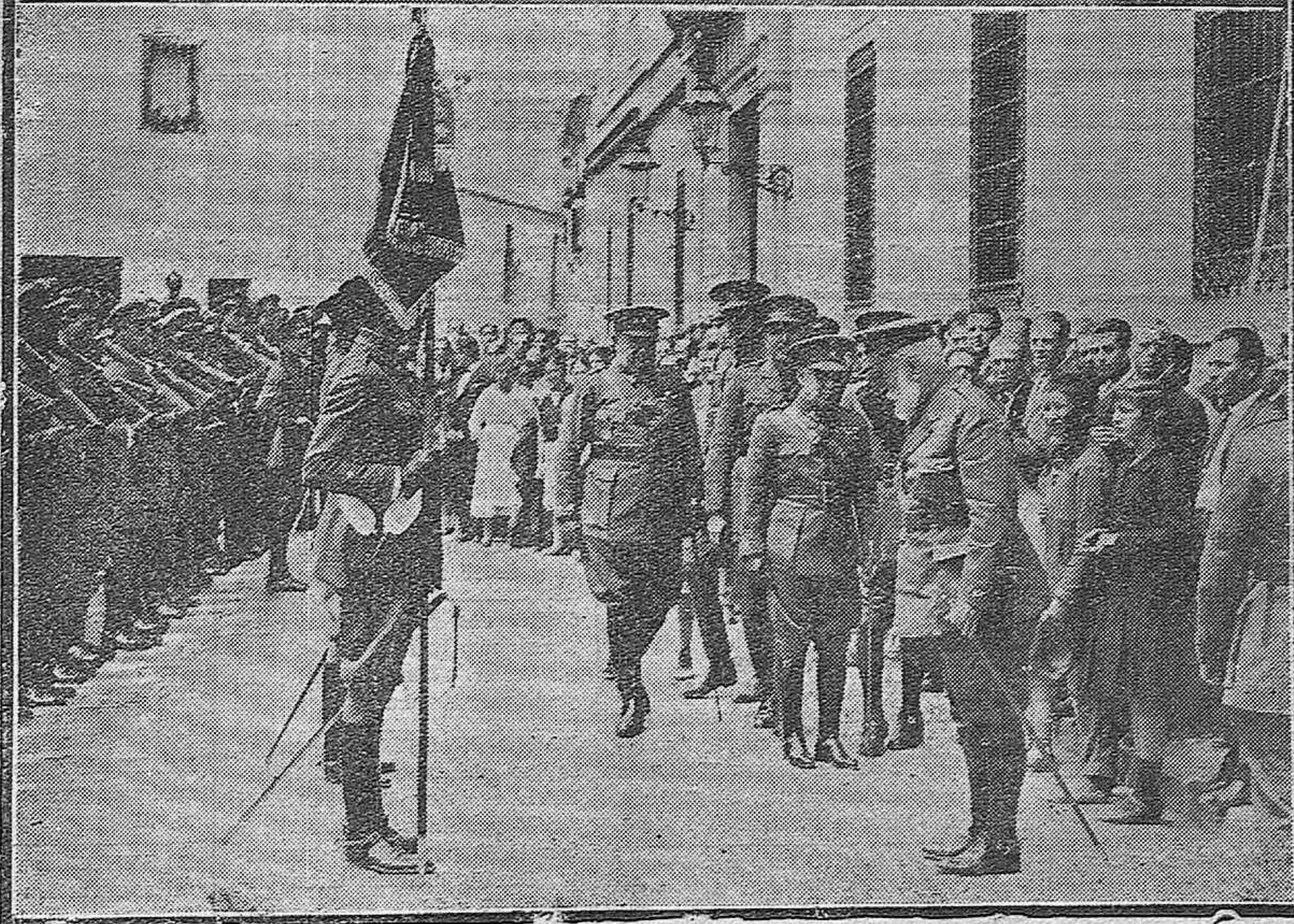
MADRID.—Toma de posesión y constitución del nuevo Consejo de Estado. Don Niceto Alcalá Zamora con todos sus compañeros de Gobierno, dando posesión al presidente y a los nuevos consejeros de Estado.