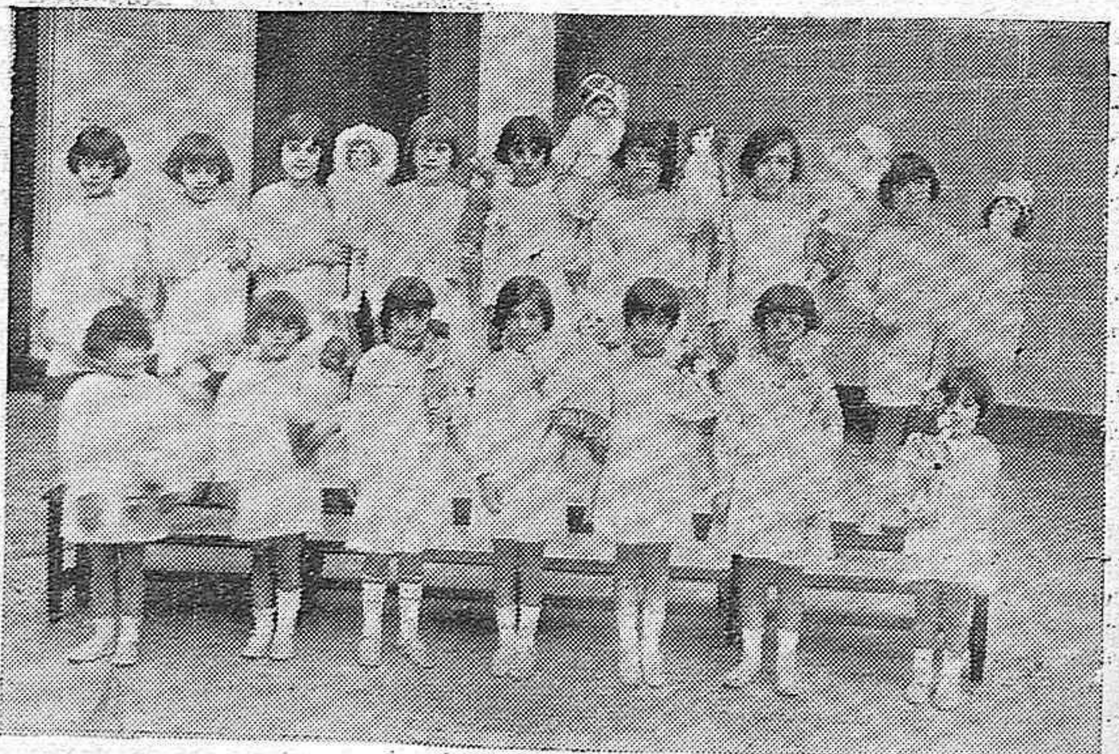
DE LA FIESTA CALASANCIA...—CORO FORMADO POR MONÍSIMAS NIÑAS; QUE RECITARON PRECIOSAS COMPOSICIONES DEDICADAS A LAS MUÑECAS

GANGA, paraguas para señoras y caballero desde 2'50 Ptas. en El Metro y sus Sucursales