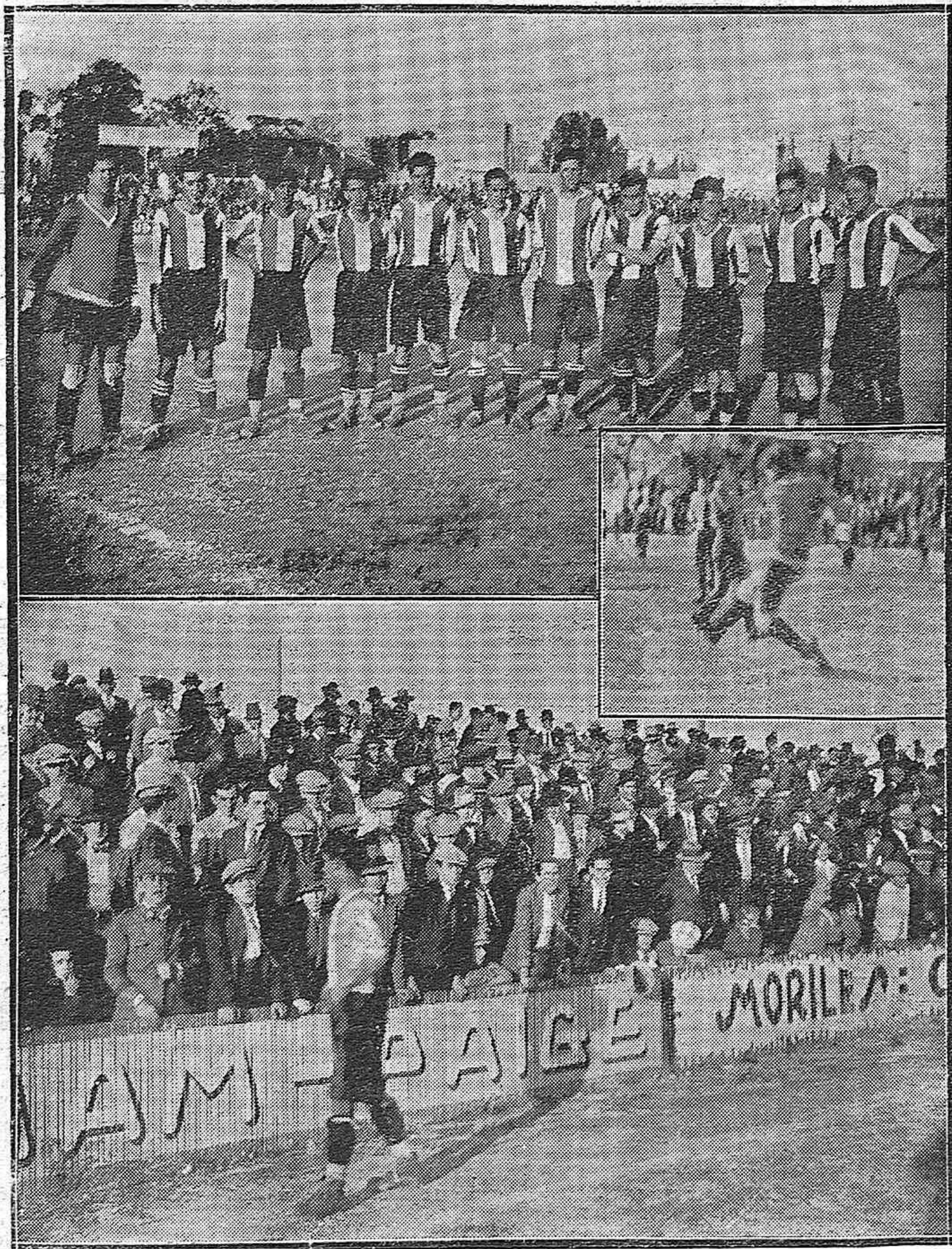
NOTAS DEPORTIVAS DEL DOMINGO.—Presentación en el Stadium América, del nuevo equipo Racing Club, que luchó contra el Real Betis, quedando vencedor.—Una vista del numeroso público que acudió.—En el centro, una salida peligrosa del portero del Racing.