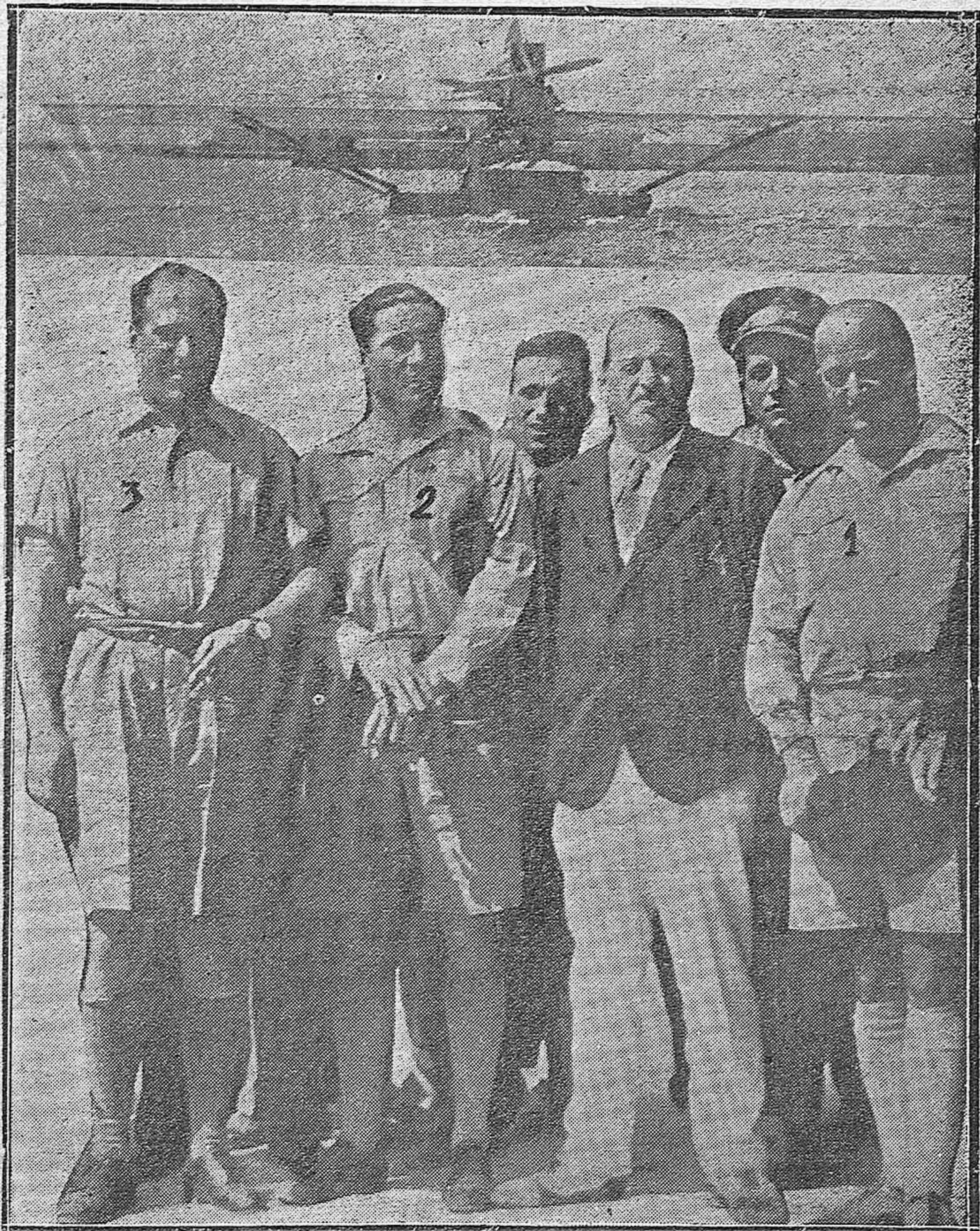
NOTAS GRAFICAS DE ACTUALIDAD.—El general Sanjurjo (4) con los intrépidos aviadores Comandante Franco (1), Gallarza (2) y Ruíz de Alda (3) antes de emprender el vuelo alrededor del mundo desde los Alcázares (Cartagena).—En la parte superior el «Dornier n.º 16» al despegar.