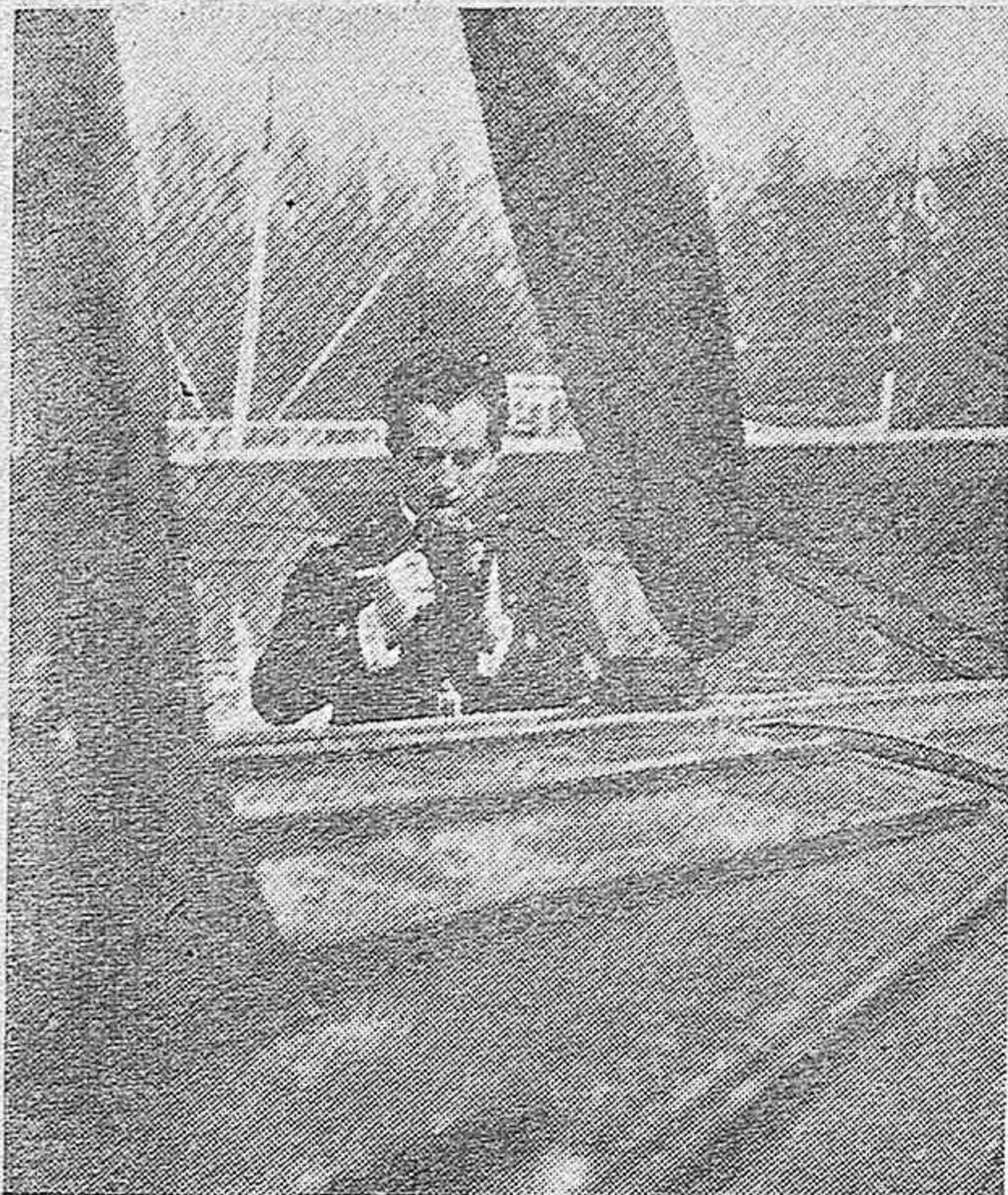
EL HEROICO COMANDANTE FRANCO, EXAMINANDO LOS APARATOS DE ORIENTACIÓN DEL «DORNIER 16» EN LA BASE DE LOS ALCÁZARES. LA VISPERA DE EMPRENDER EL TRÁGICO VUELO, QUE TIENE CONSTERNADA A ESPAÑA ENTERA