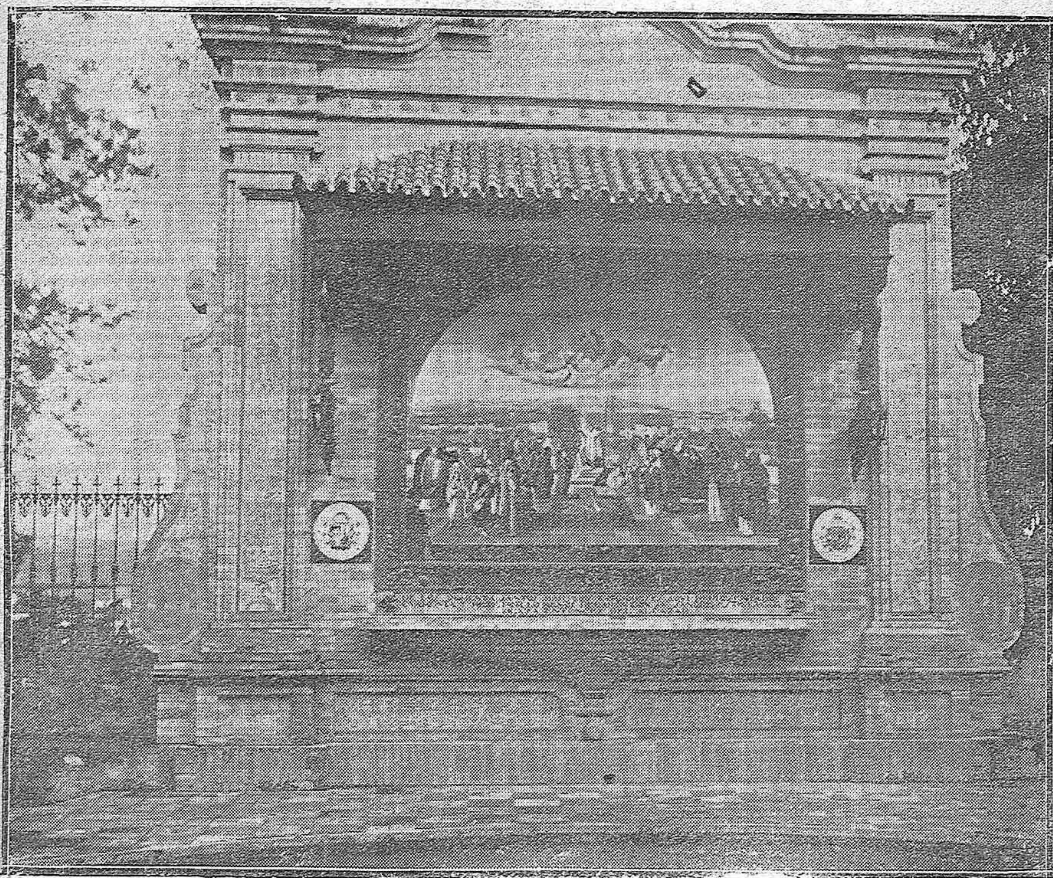
Monumento levantado a los Santos Mártires de Córdoba, en el Patio Central del Seminario de San Pelagio.