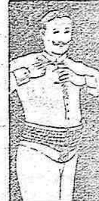
FAJA DE CABALLERO