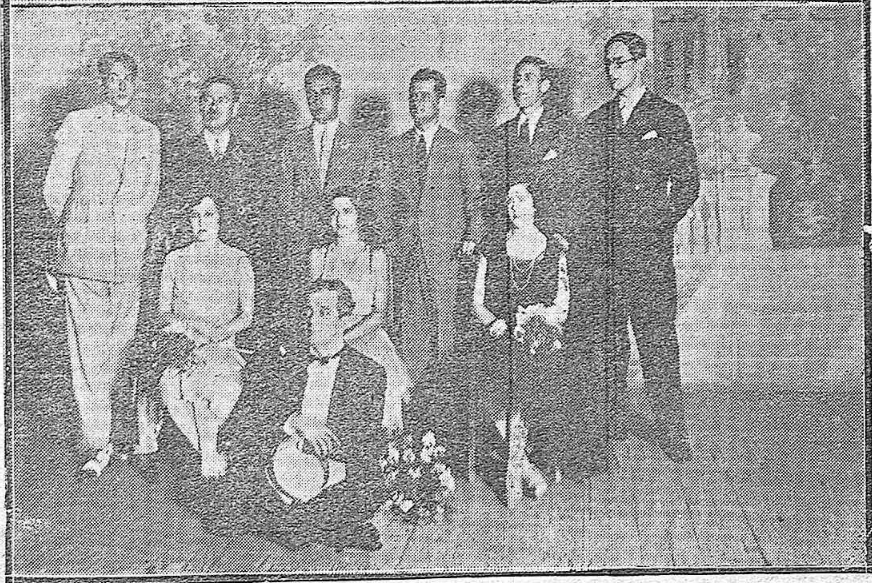
EL FESTIVAL DE ANOCHE EN EL GRAN TEATRO.—Bellísimas señoritas que tomaron parte en la función organizada por la Junta de Damas de la Acción Católica de la Mujer.— El aplaudido autor don Felipe Sassone, con los distinguidos «comediantes», intérpretes de las obras representadas.