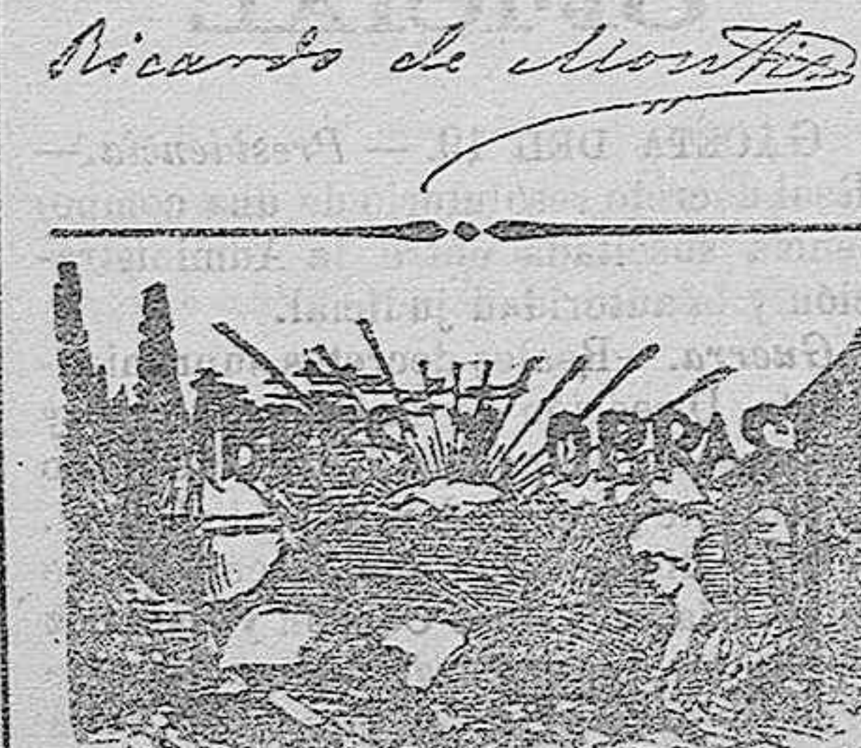
EL INFANTE DON ANTONIO PASCUAL

Soledad acababa de complacer á su hermana, dándole el último abrazo que recibiría; con él habíala estrangulado.