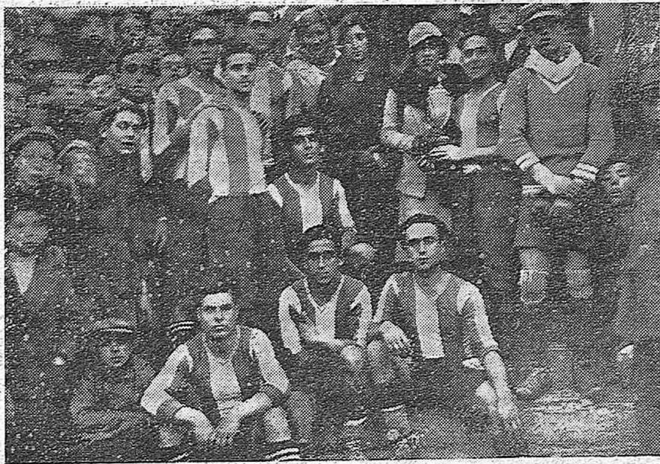
ENTREGA DE LA COPA PADILLA AL EQUIPO RACING CLUB, DE CÓRDOBA, AL TRIUNFAR EN LOS DOS PARTIDOS CONTRA EL EQUIPO INGLÉS ARMY MEDICAL CORPS.

Al acto asistieron, como comensales, la exreina de Portugal, doña Amelia; el duque de Aosta, la princesa María Adelaida de Saboya y otras muchas distinguidas personalidades de la corte y de la política.