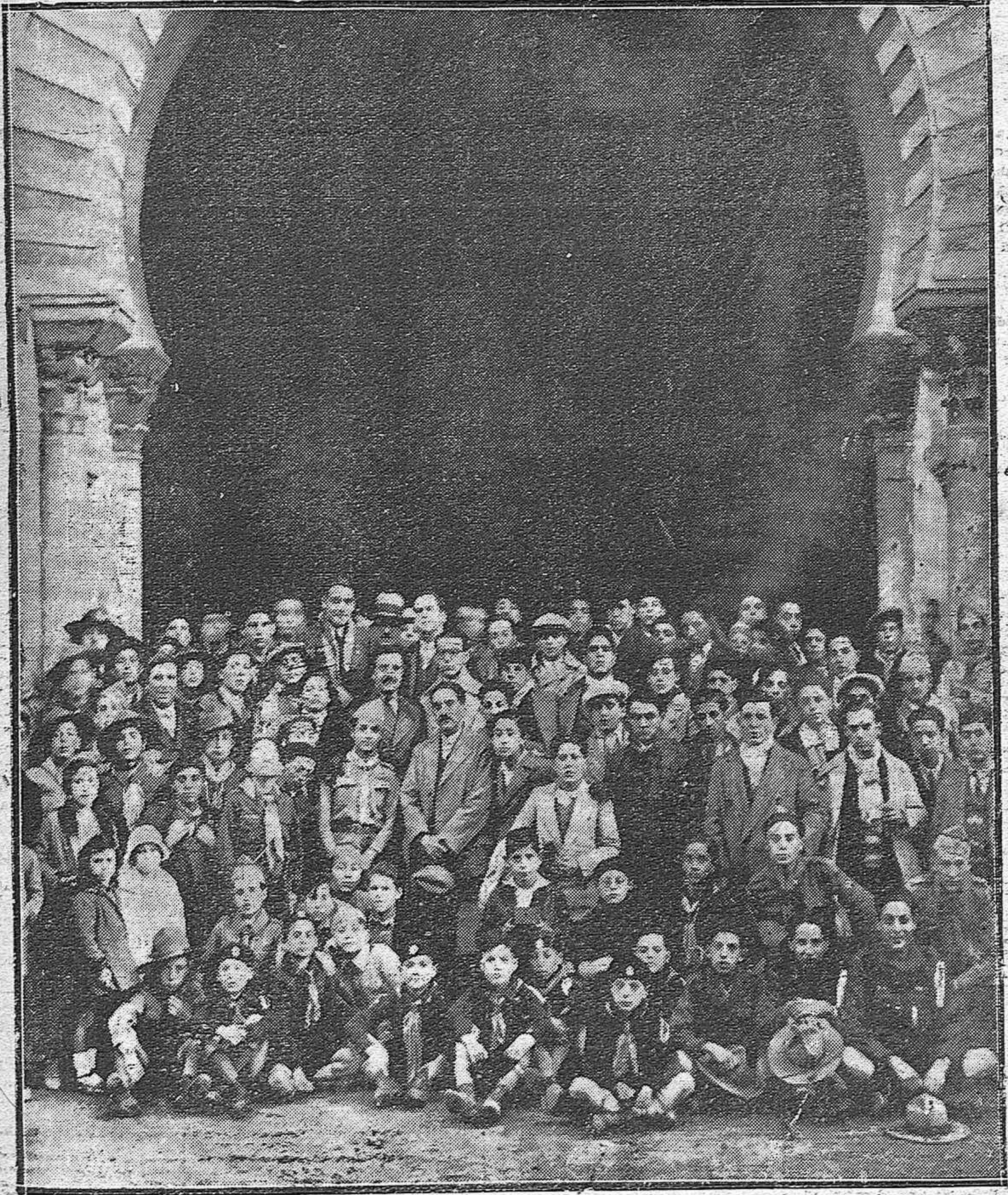
TURISMO.--Los excursionistas de Argelia y Oran, que invitados por el Gobierno español, visitan nuestra patria en unión de una sección de Exploradores madrileños.--Los excursionistas al salir de visitar la Mezquita.