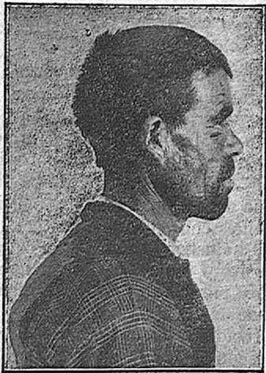
"Perico", visto de perfil