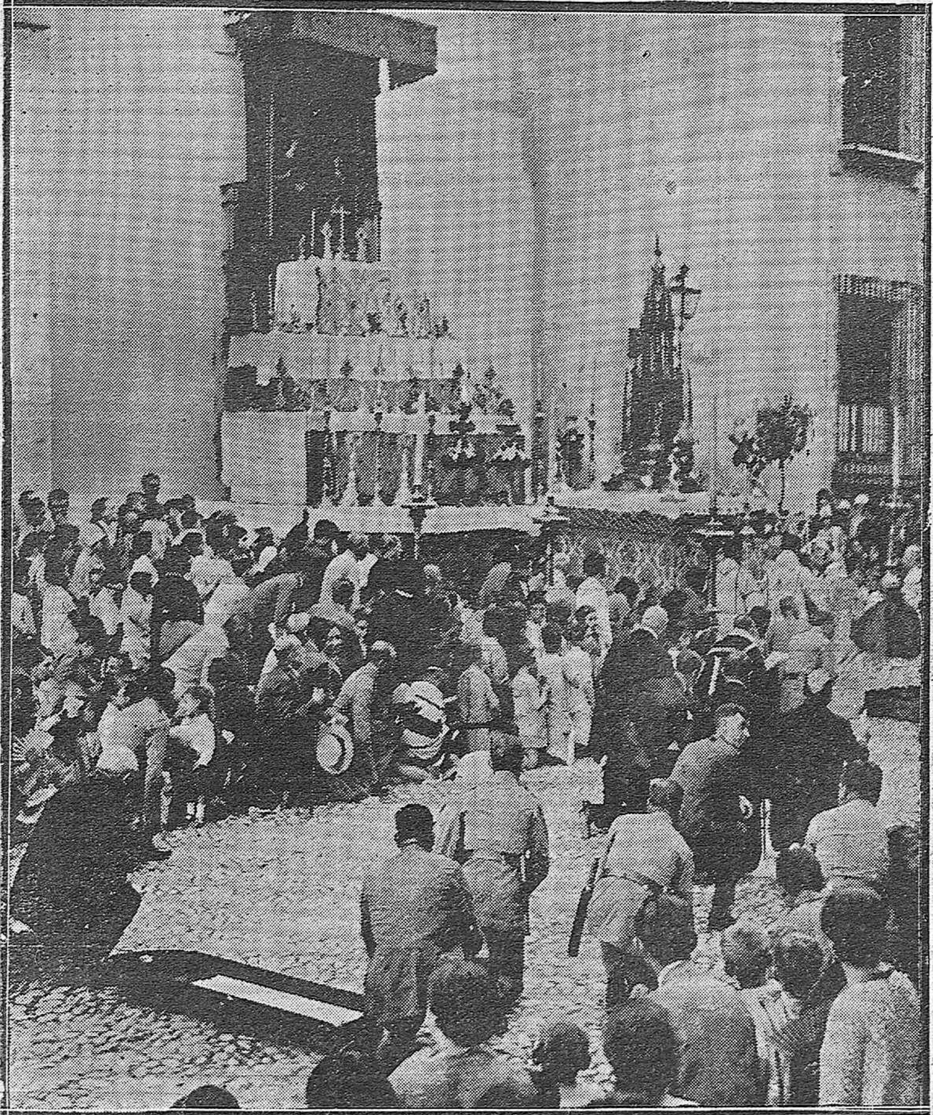
LA FESTIVIDAD DE AYER TARDE. — MOMENTO DE LLEGAR LA CUSTODIA AL ALTAR LEVANTADO EN LA FACHADA DEL PALACIO EPISCOPAL.