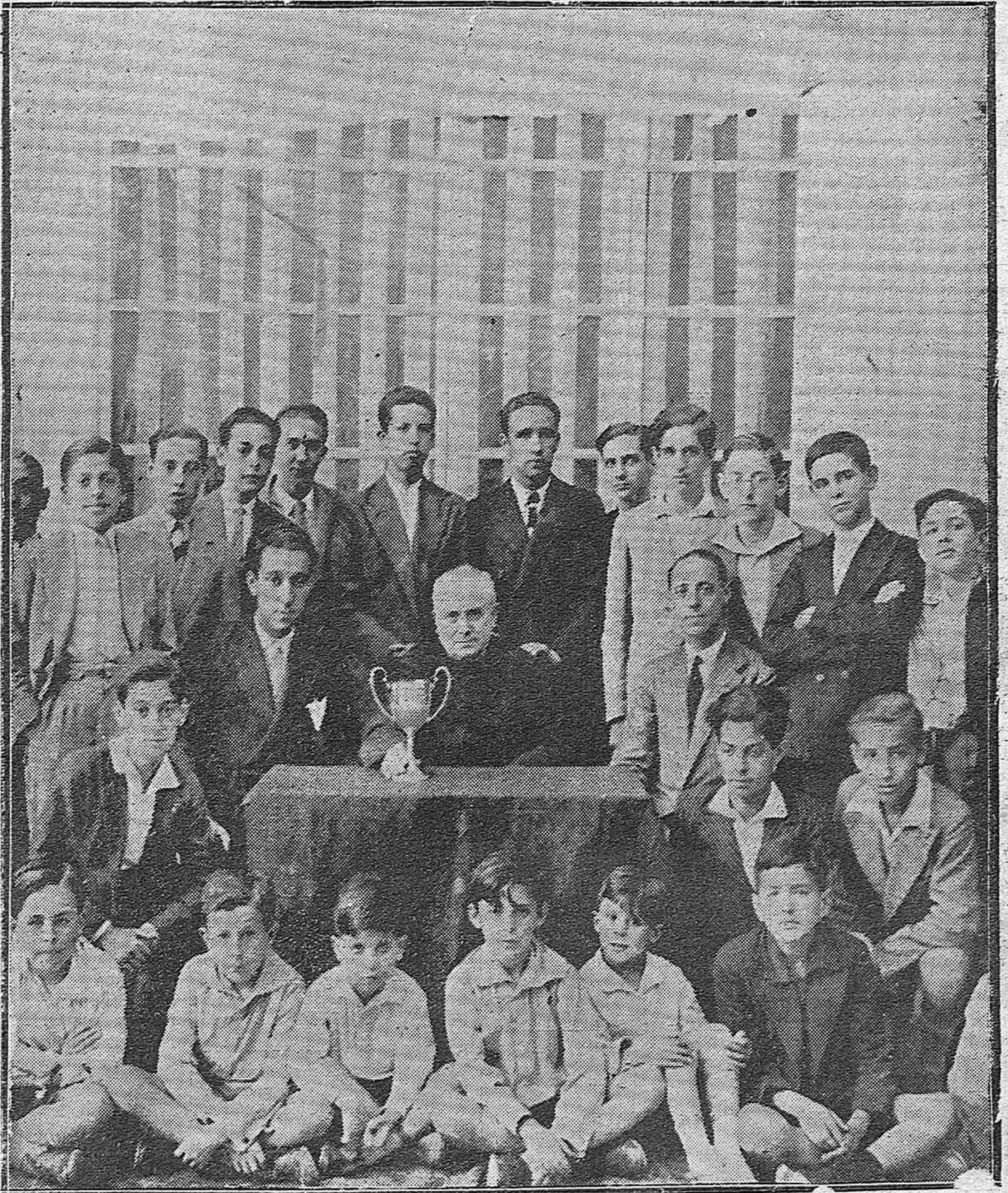
TERMINACION DEL CAMPEONATO ESCOLAR DE 1930.—ENTREGA DE LA COPA POR EL PRESIDENTE DEL RACING CLUB DE CORDOBA AL EQUIPO VENCEDOR C. M. SAN HIPOLITO, ASISTIENDO AL ACTO EL EQUIPO INFANTIL DEL SAN HIPOLITO.