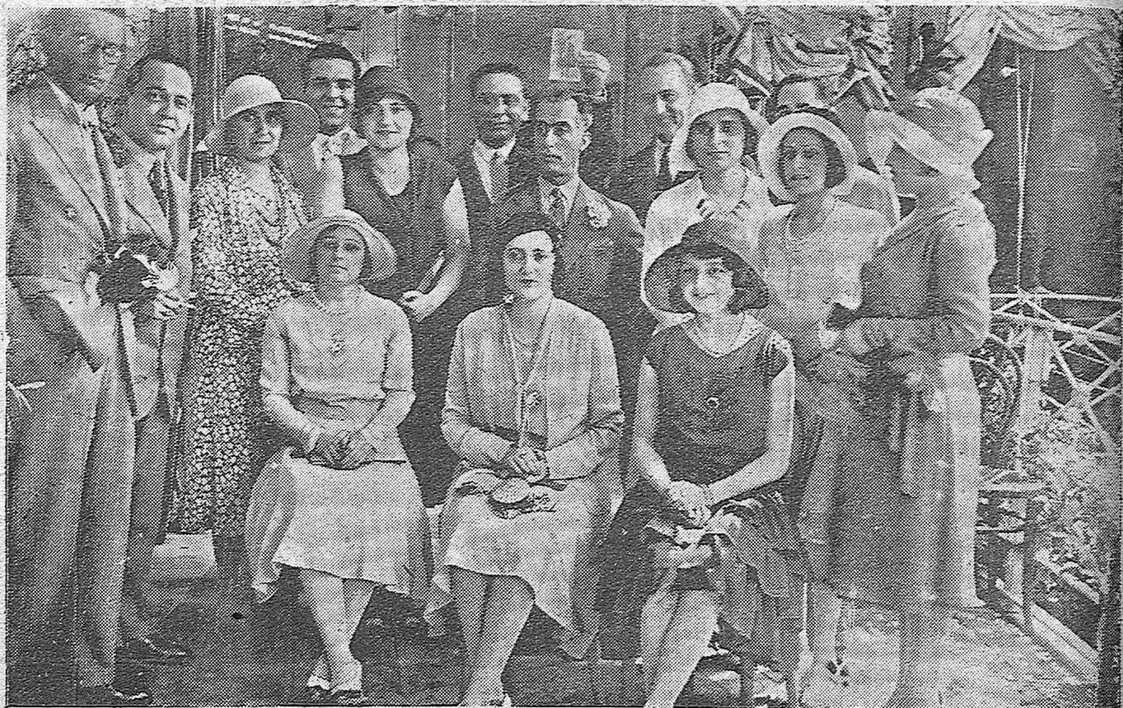
EN LA CASETA DE LA AMISTAD.—UN GRUPO DE DISTINGUIDOS JÓVENES QUE ASISTIERON AL ÚLTIMO BAILE MATINAL.