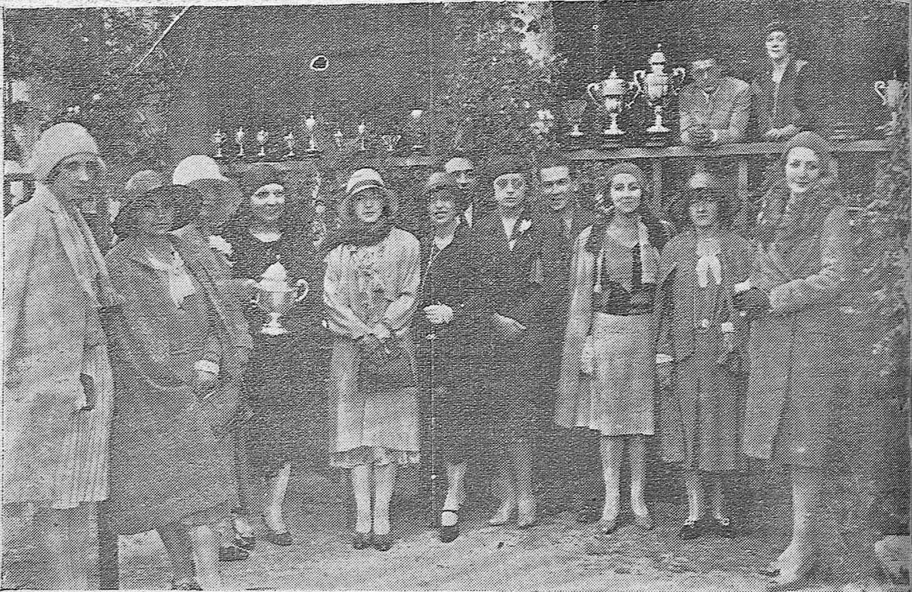
EN EL TIRO DE PICHÓN.—BELLÍSIMAS SEÑORITAS QUE ENTREGARÁN LAS COPAS A LOS VENCEDORES Y QUE ASISTIERON AYER A LAS PRIMERAS PRUEBAS.