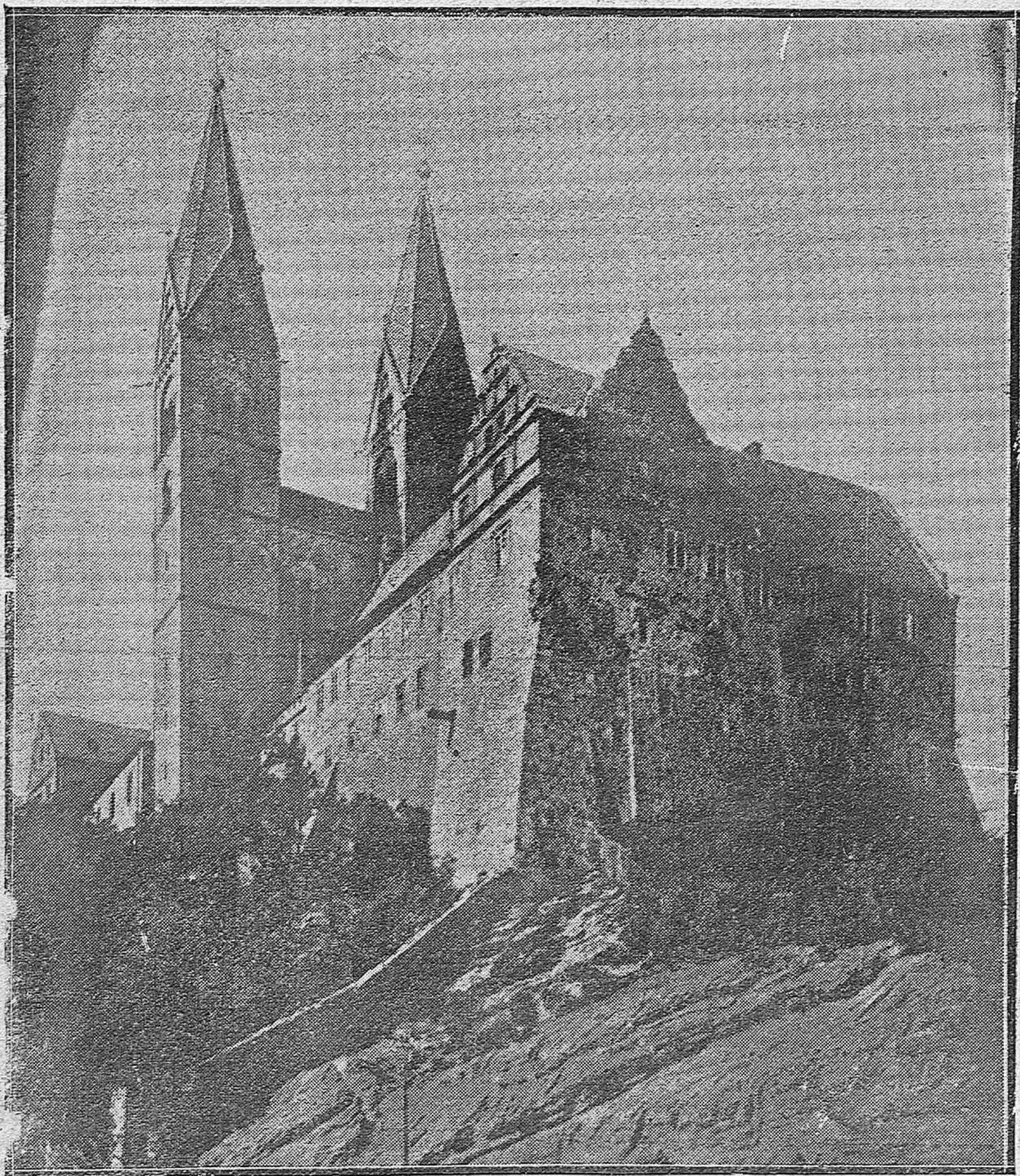
LOS RECIENTES TERREMOTOS DE ITALIA. — EL MAGNÍFICO CASTILLO DEL CONDE DE VOLSI, ENCLAVADO EN LAS INMEDIACIONES DE NÁPOLES, Y DEL QUE NO HA QUEDADO PIEDRA SOBRE PIEDRA.