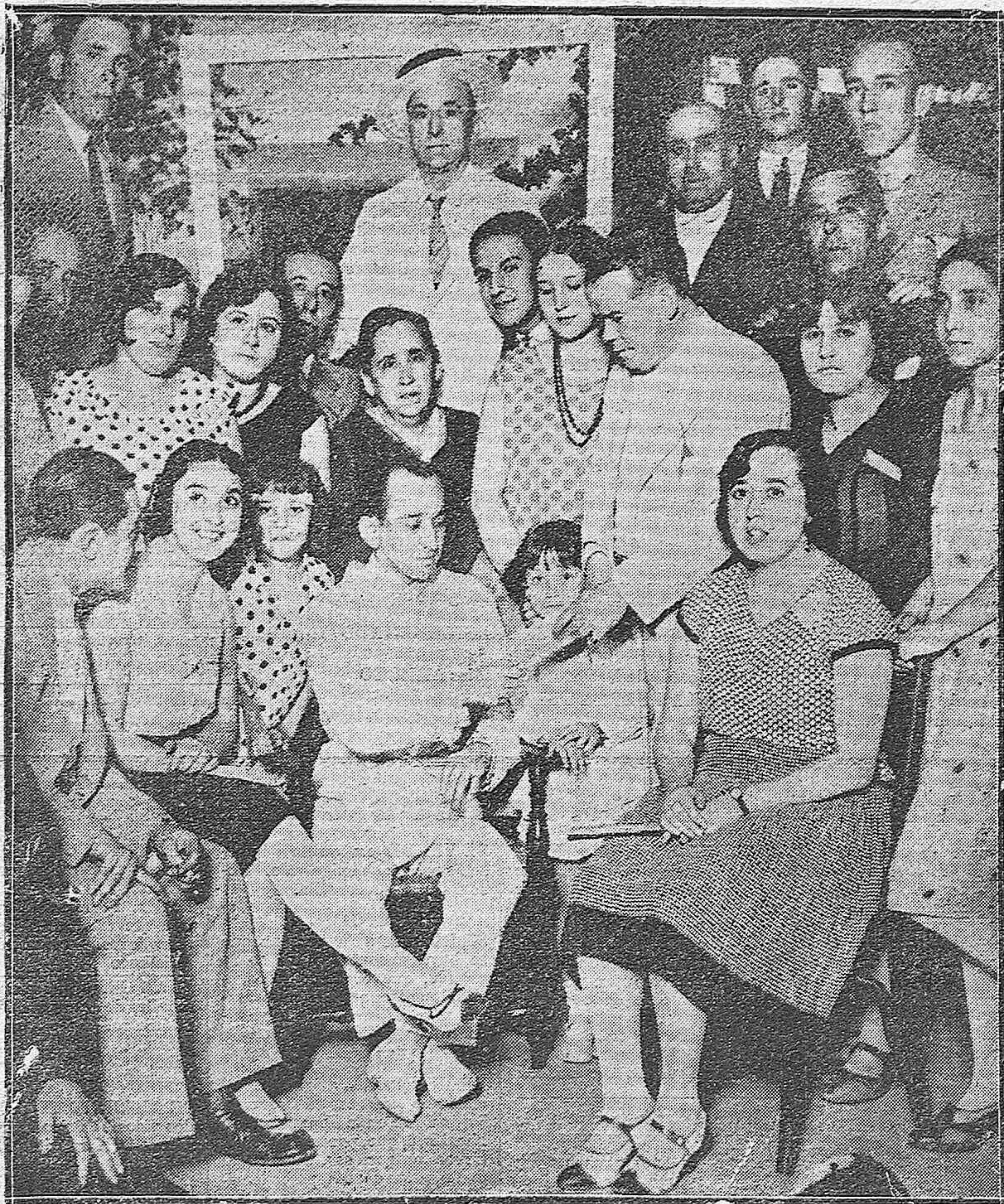
ENTREGA DE UNA CUESTACION. — EL DIESTRO PAREJITO, EN UNIÓN DE SUS FAMILIARES, RECIBIENDO DE LA COMISIÓN ORGANIZADORA EL IMPORTE DE LA SUSCRIPCIÓN ABIERTA EN SU FAVOR.