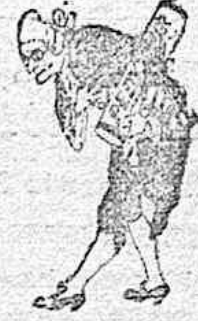
A los pies de Vd.