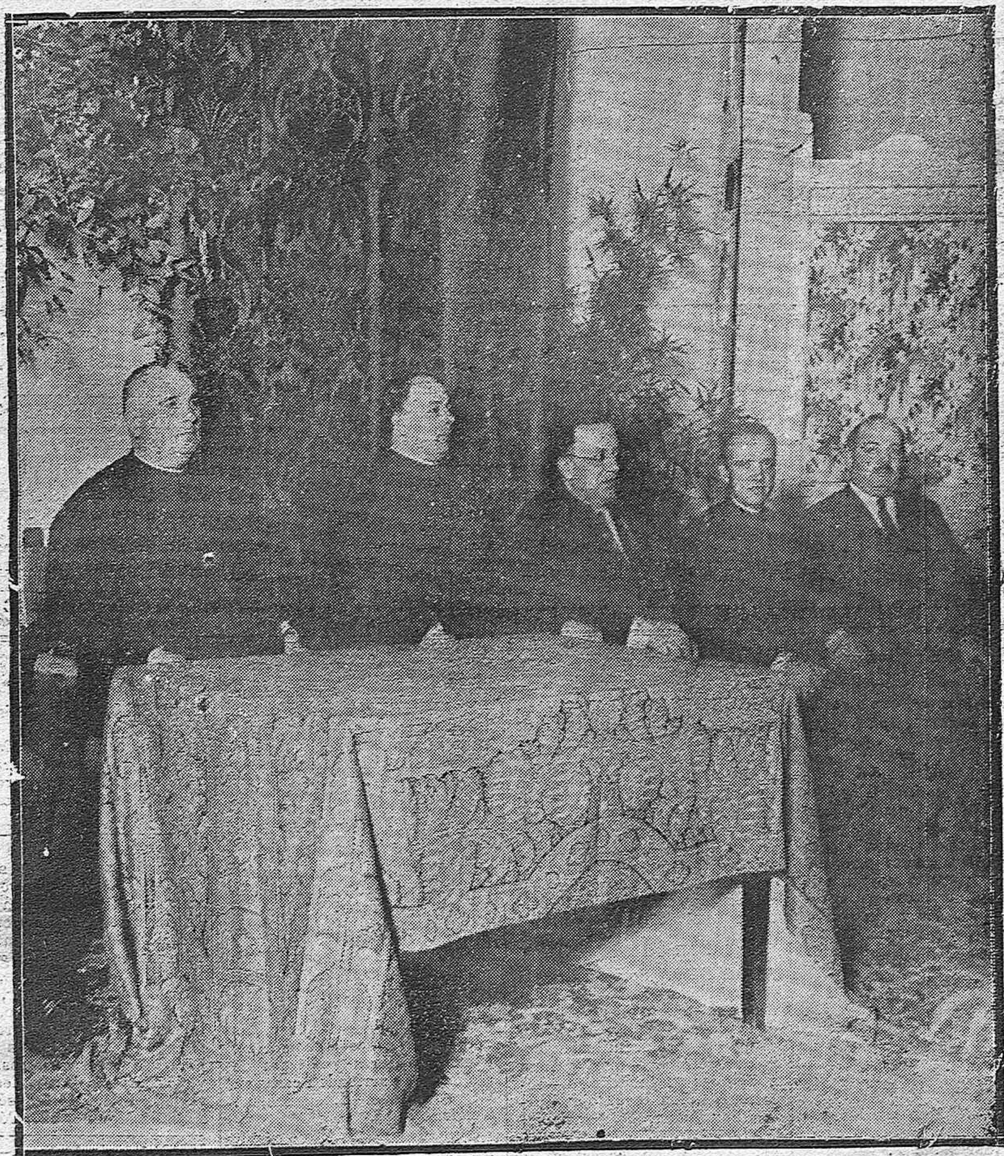
CURSILLO PARA MAESTRAS NACIONALES.—PRESIDENCIA DEL ACTO DE CLAUSURA Y ORADORES QUE INTERVINIERON.