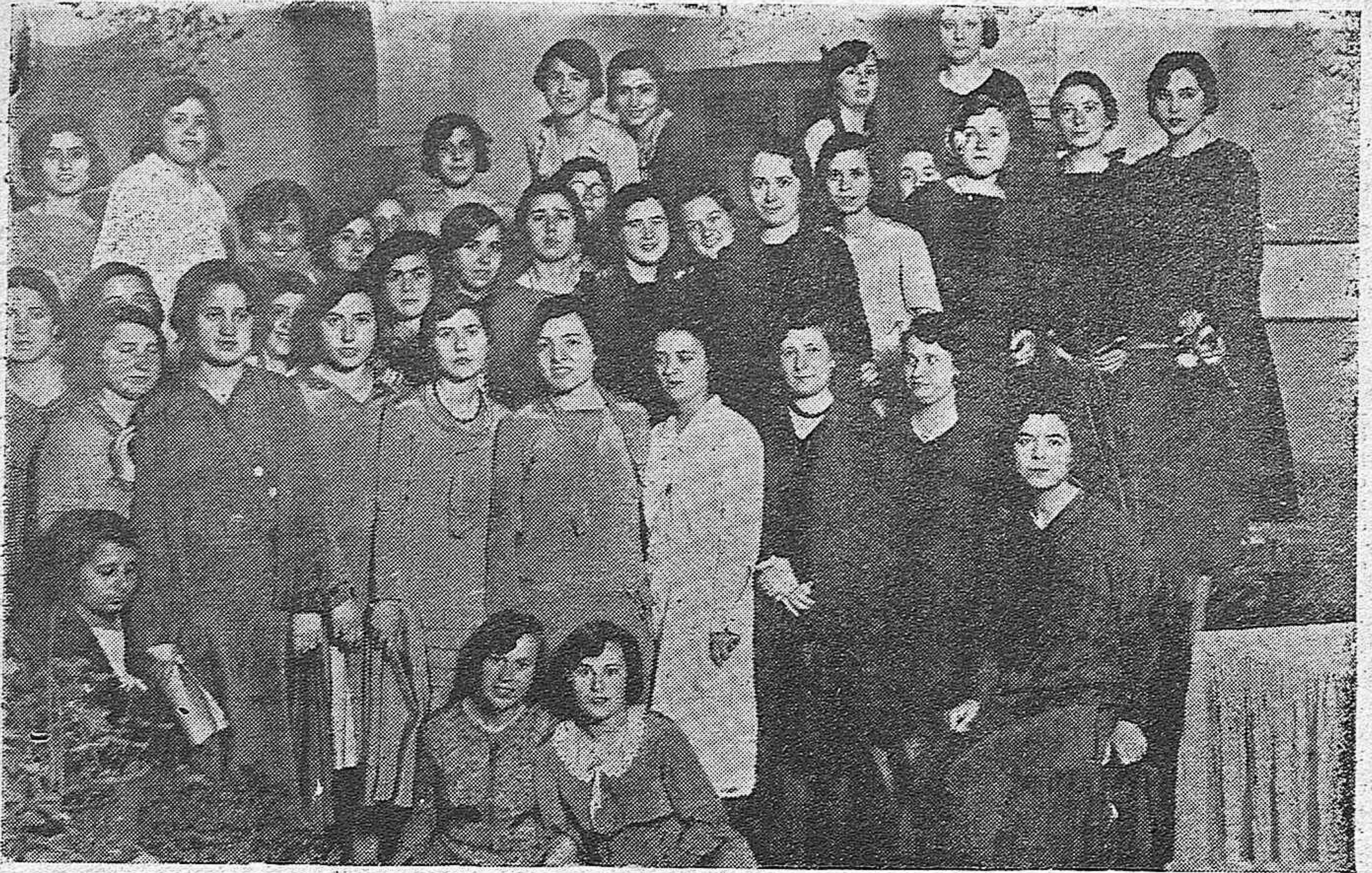
MAESTRAS NACIONALES QUE HAN ASISTIDO AL CURSILLO DE PERFECCIONAMIENTO CELEBRADO EN LAS TERESIANAS.