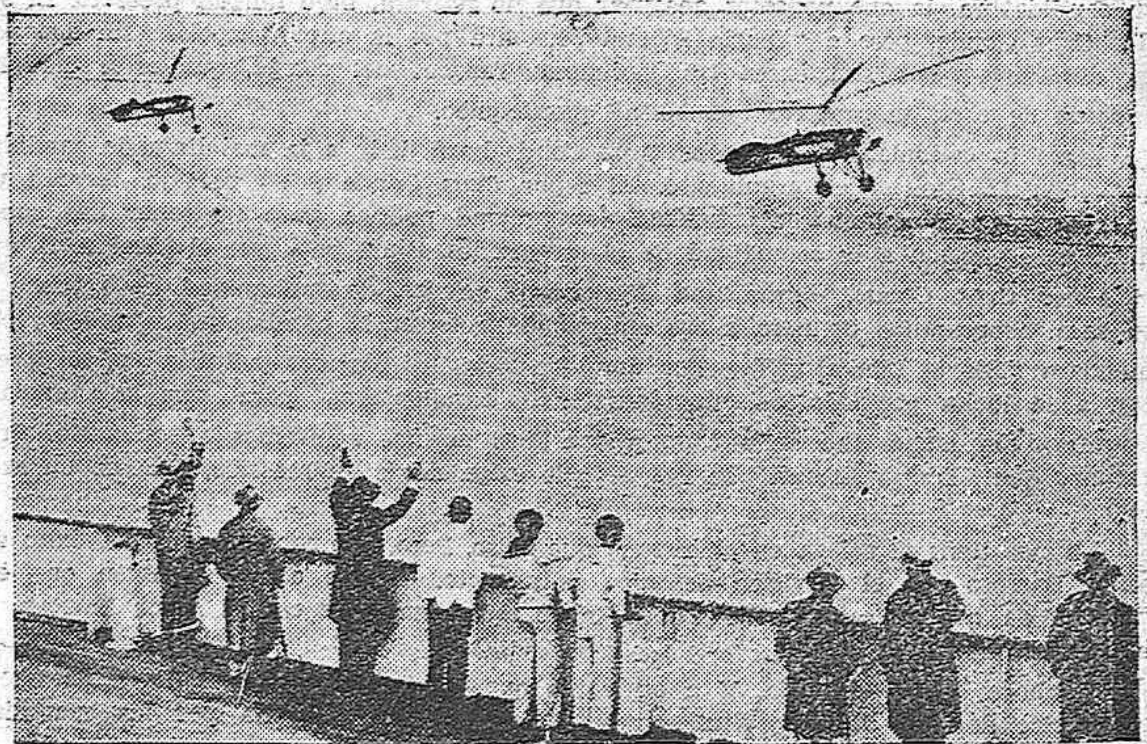
NUEVA YORK.—Dos autogiros modelo Cierva volando sobre el vapor "Bremen".

El detenido ingresó en la cárcel a disposición del juzgado correspondiente.