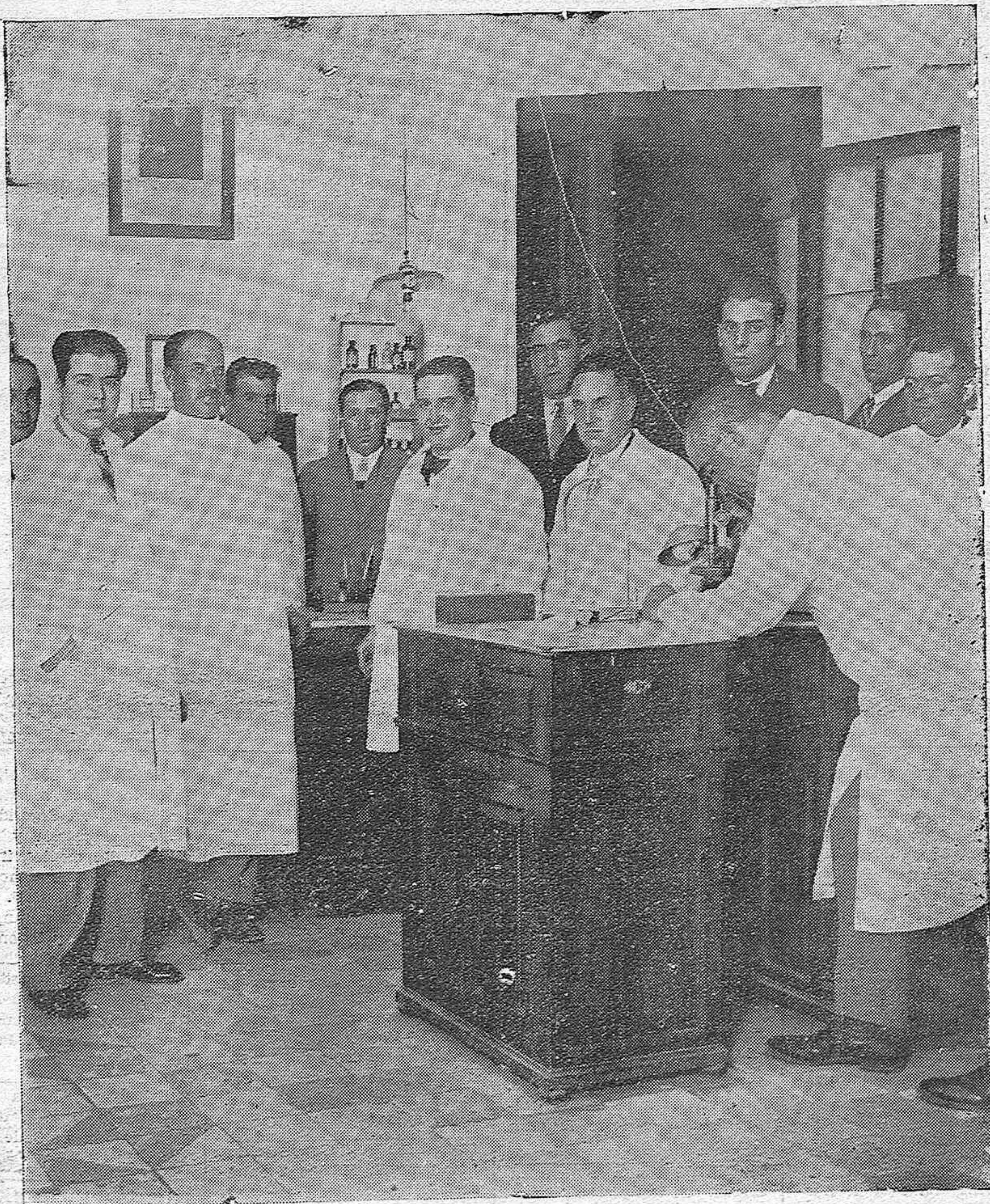
INSTITUTO PROVINCIAL DE HIGIENE.—Con motivo de la inauguración del curso para veterinarios oficiales de la provincia. Una de las clases prácticas durante el desarrollo de la primera conferencia.