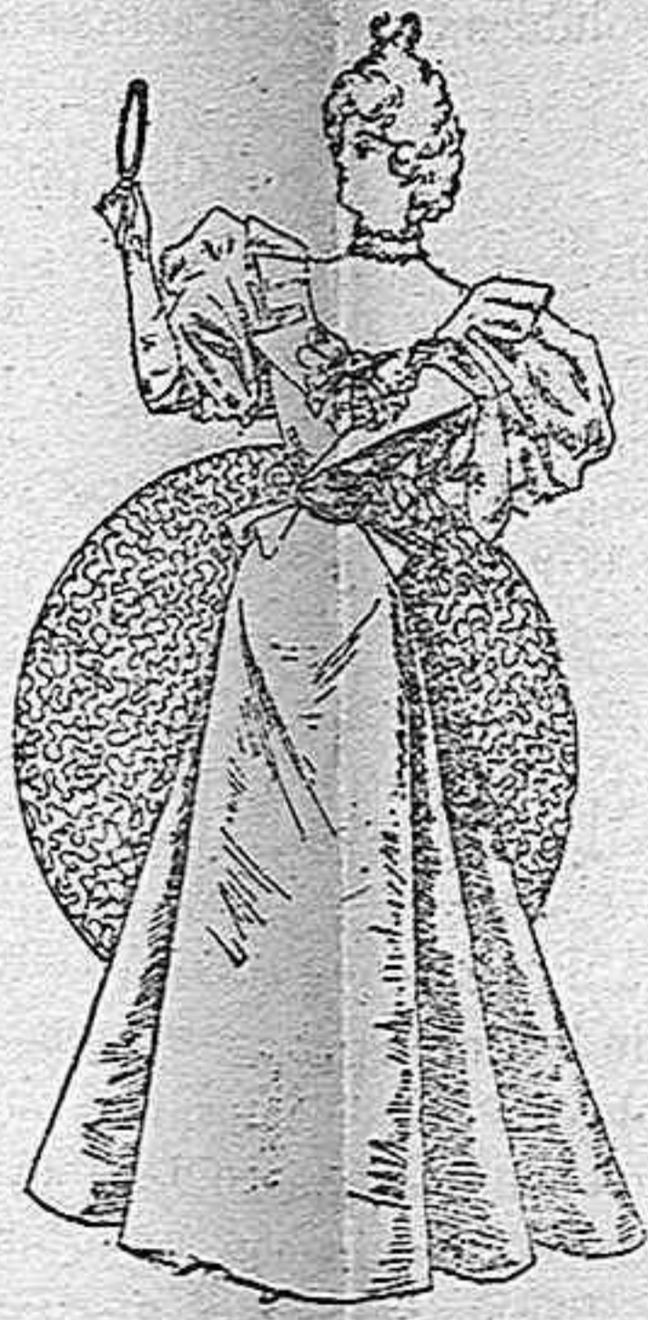
Traje para reunión.

Modelos exclusivos para nuestras lectoras, de los grandes almacenes de «El Siglo», Barcelona. (1)