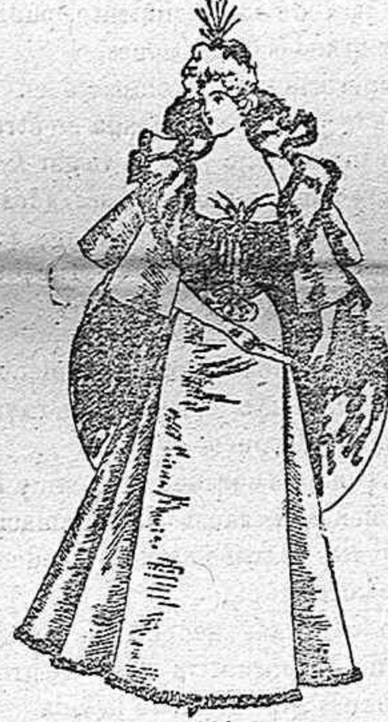
Salida de teatro.

Del género hoy más en boga, de rosa blanco. El cuerpo, que como veis es escotado, lleva mangas cortas muy abullonadas de terciopelo miroir, adornando los hombros una tira de encaje que se combina artística y graciosamente con una guirnalda de rosas. El delantero del cuerpo, de gasa de seda blanca se recoge en el centro con un alfiler, si puede ser de brillantes, mucho mejor. La falda, de raso blanco muy acampanada, y, como complemento de tan hermoso traje, un cinturón de terciopelo igual al de las mangas abrochado con dos elegantes botones, que sujeten dos bouquets de rosas.