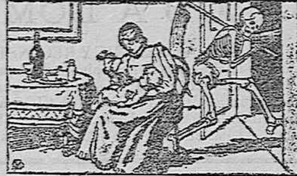
La enhorabuena á los padres.

Se venden en todas las farmacias á pesetas 3'90.—Depósito por mayor en Córdoba, señores Fuentes hermanos, calle del Paraíso, 10.