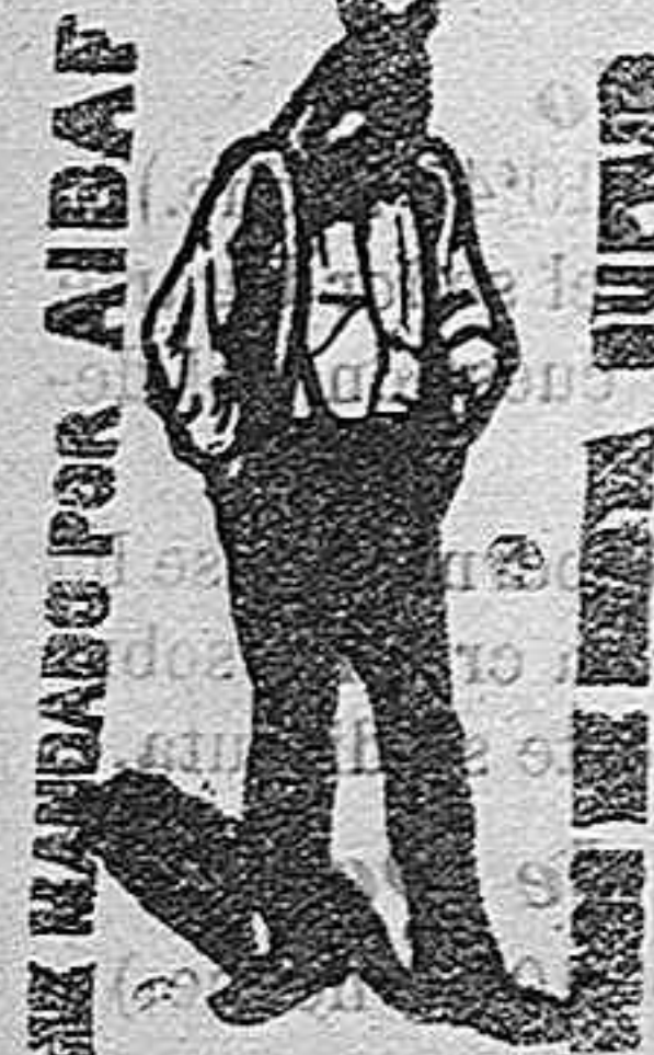
AL MARCHAR POR AIBAF