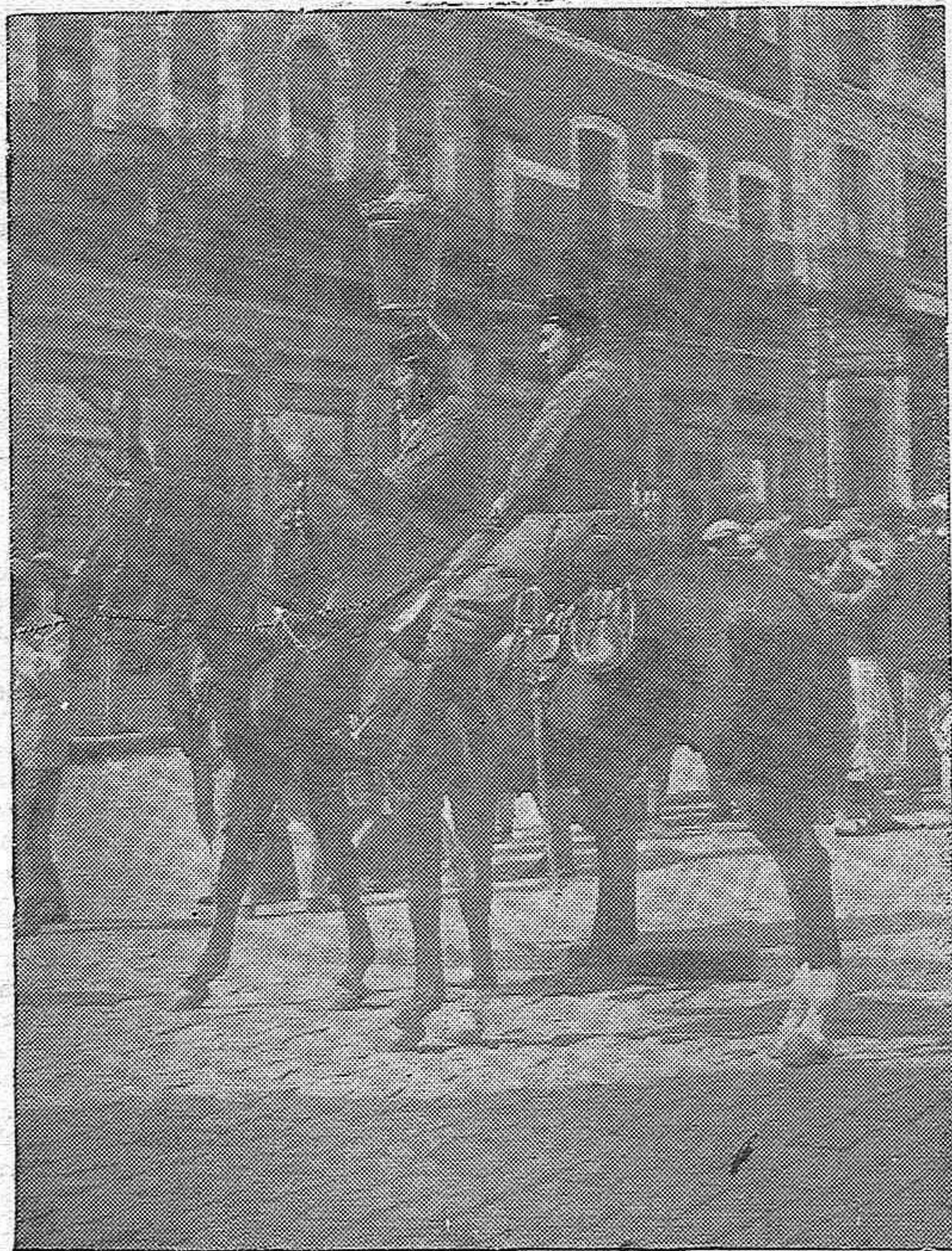
LA CRISIS OBRERA EN CORDOBA.—La Guardia civil prestando servicio de vigilancia en las calles para evitar que se repitan los sucesos de ayer.