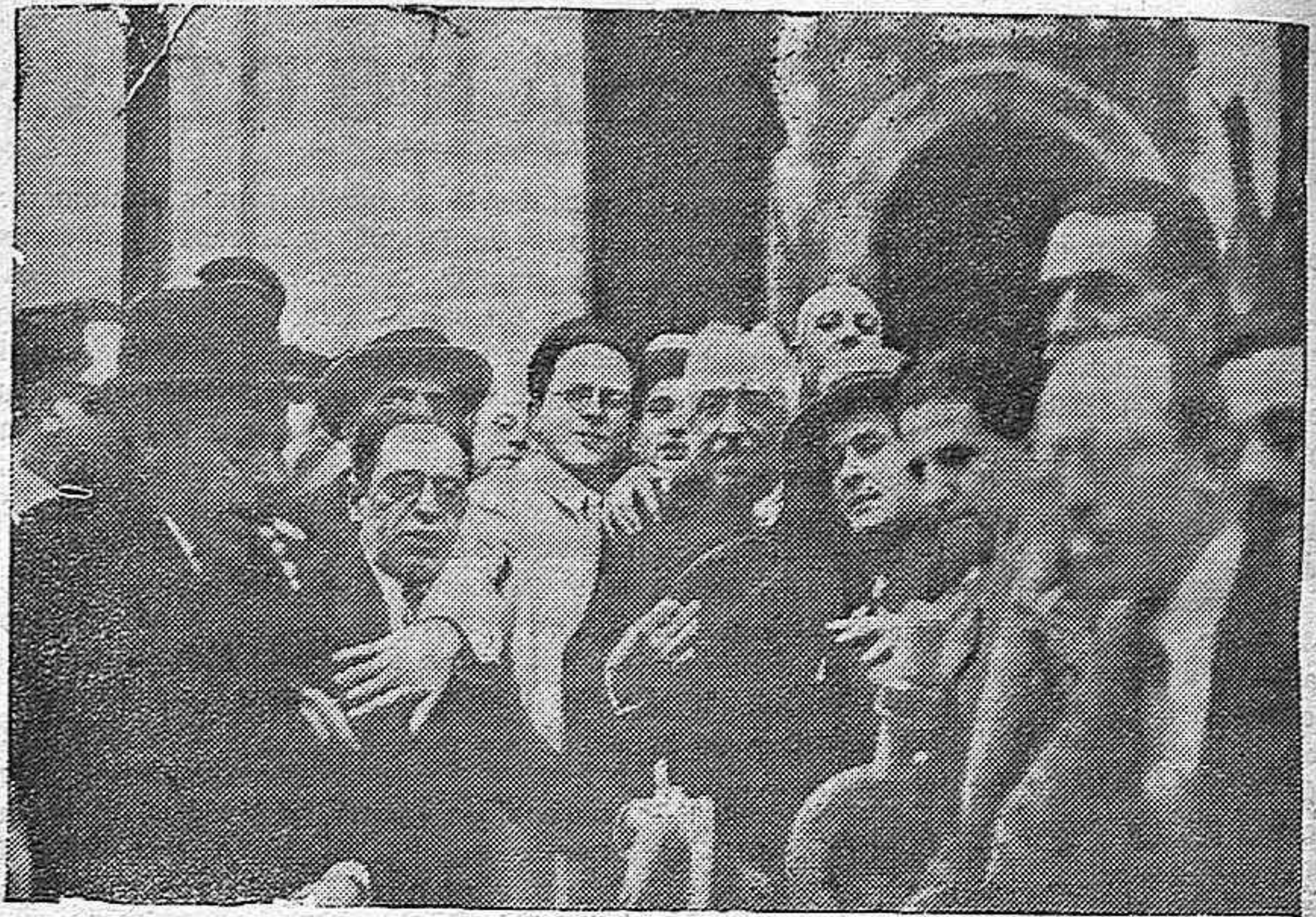
MADRID.—En la Cárcel Modelo.—El señor Alcalá Zamora al ser puesto en libertad en la tarde de ayer