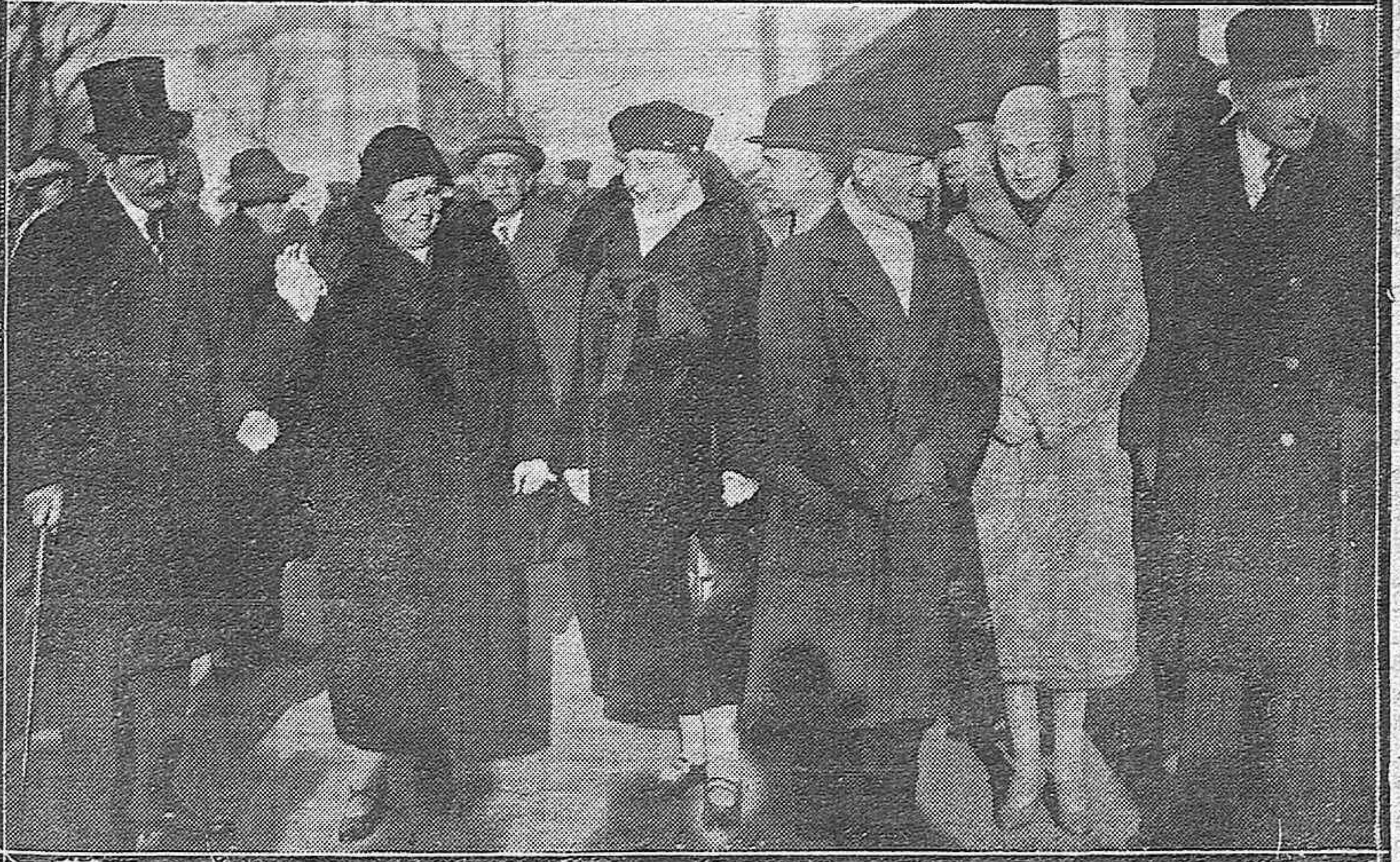
MADRID. El expresidente de la República del Perú don Oscar Benavides (+) nombrado ministro plenipotenciario de su país acompañado del introductor de embajadores duque de Vistahermosa, y los agregados a la Legación, al salir del Hotel Ritz para presentar al Rey sus cartas credenciales.