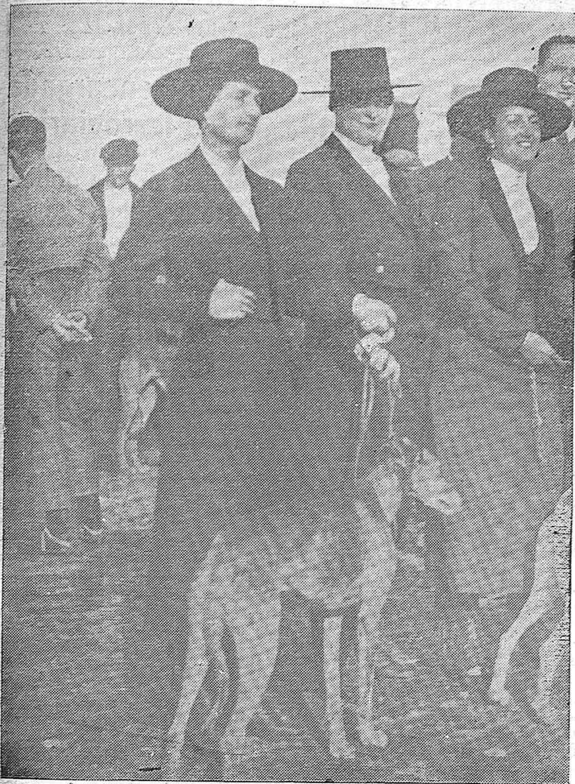
SEVILLA. Distinguidas damas concurrentes al Campeonato de gaizos, y el perro "Adán" ganador de la prueba. (Foto Gonzanhi).