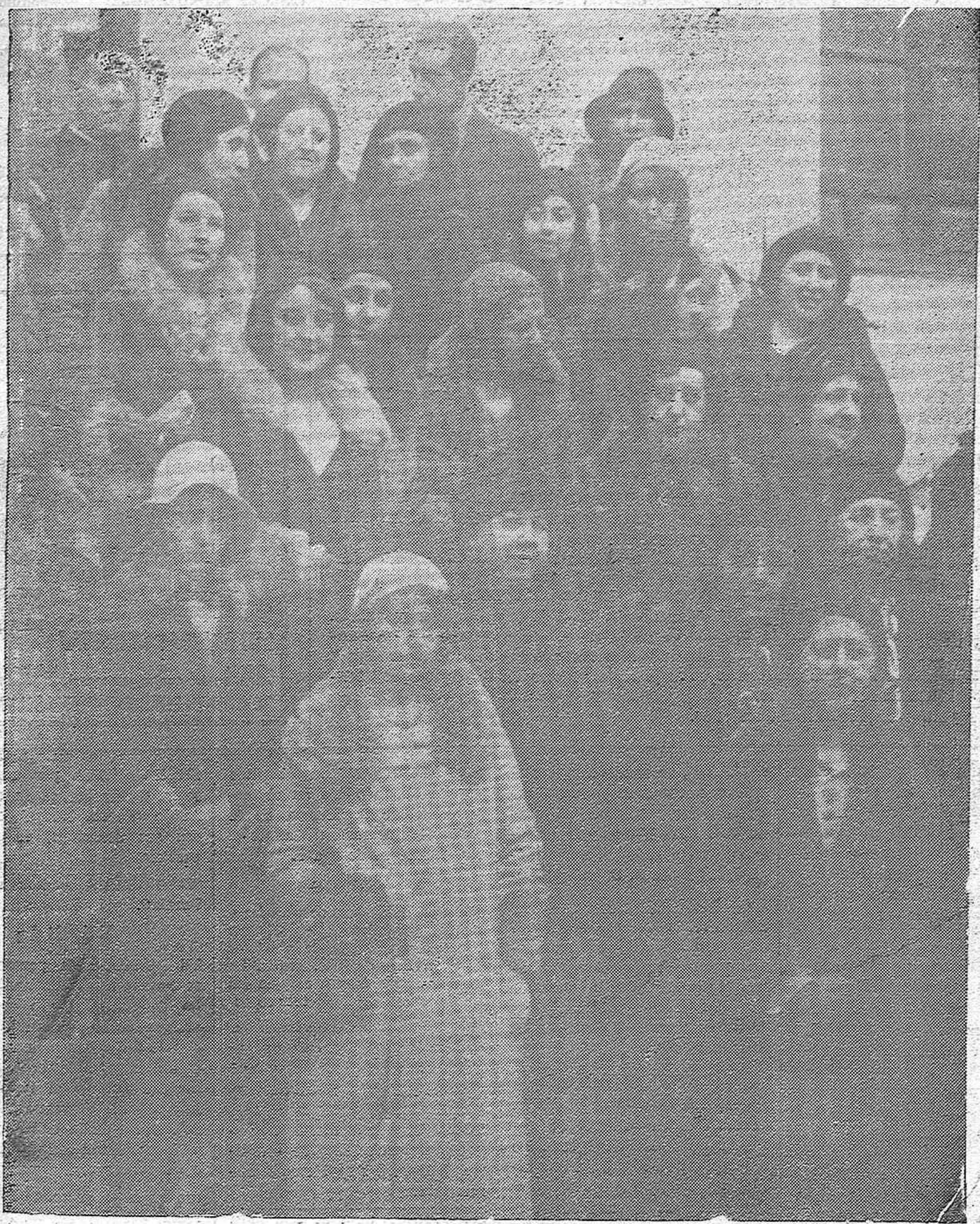
EN LAS ESCUELAS SALESIANAS.—Distin - guidas damas y señoritas que llevaron a cabo la distribución de ropas entre los niños, pobres que reciben educación en las mencionadas escuelas.