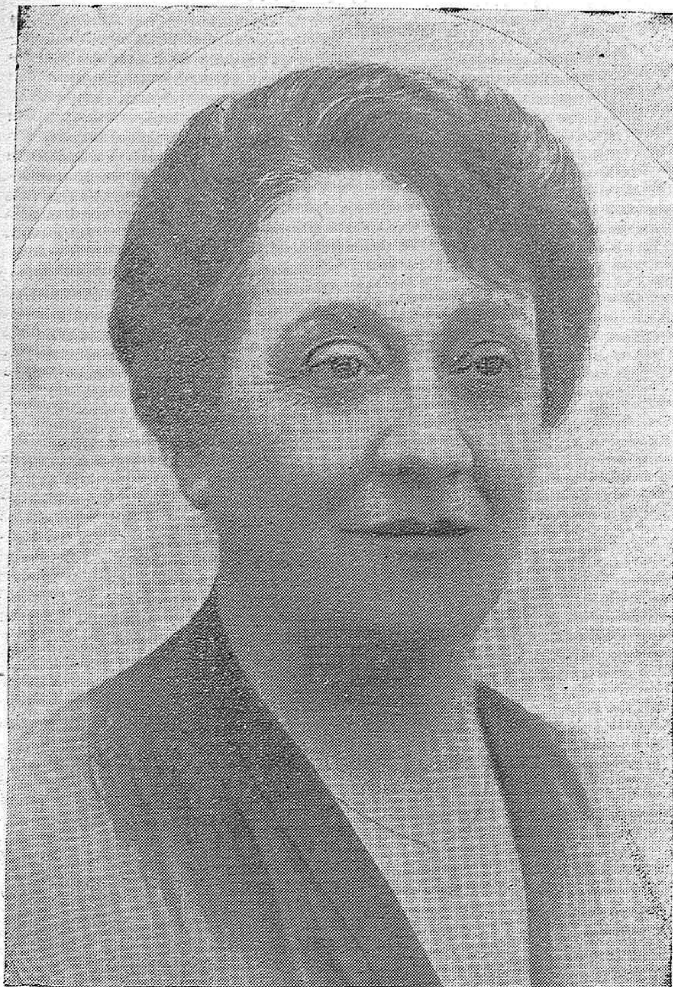
IRENE ALBA, LA INSIGNE ACTRIZ ESPAÑOLA, QUE CON OTRAS FIGURAS MANTUVO DURANTE CUARENTA AÑOS EL PRESTIGIO DE NUESTRO TEATRO, Y QUE ACABA DE FALLECER EN BARCELONA A CONSECUENCIA DE UNA HEMIPLEJÍA