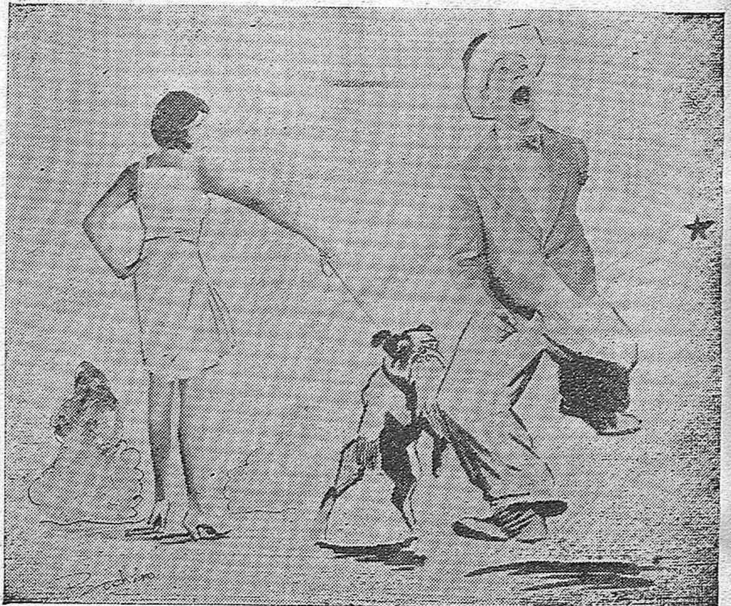
STAN LAUREL, EL CÉLEBRE ACTOR CÓMICO CINEMATOGRAFICO, LLEVA SU MERECIDO POR CONVERTIRSE EN FÁCIL PIROPEADOR