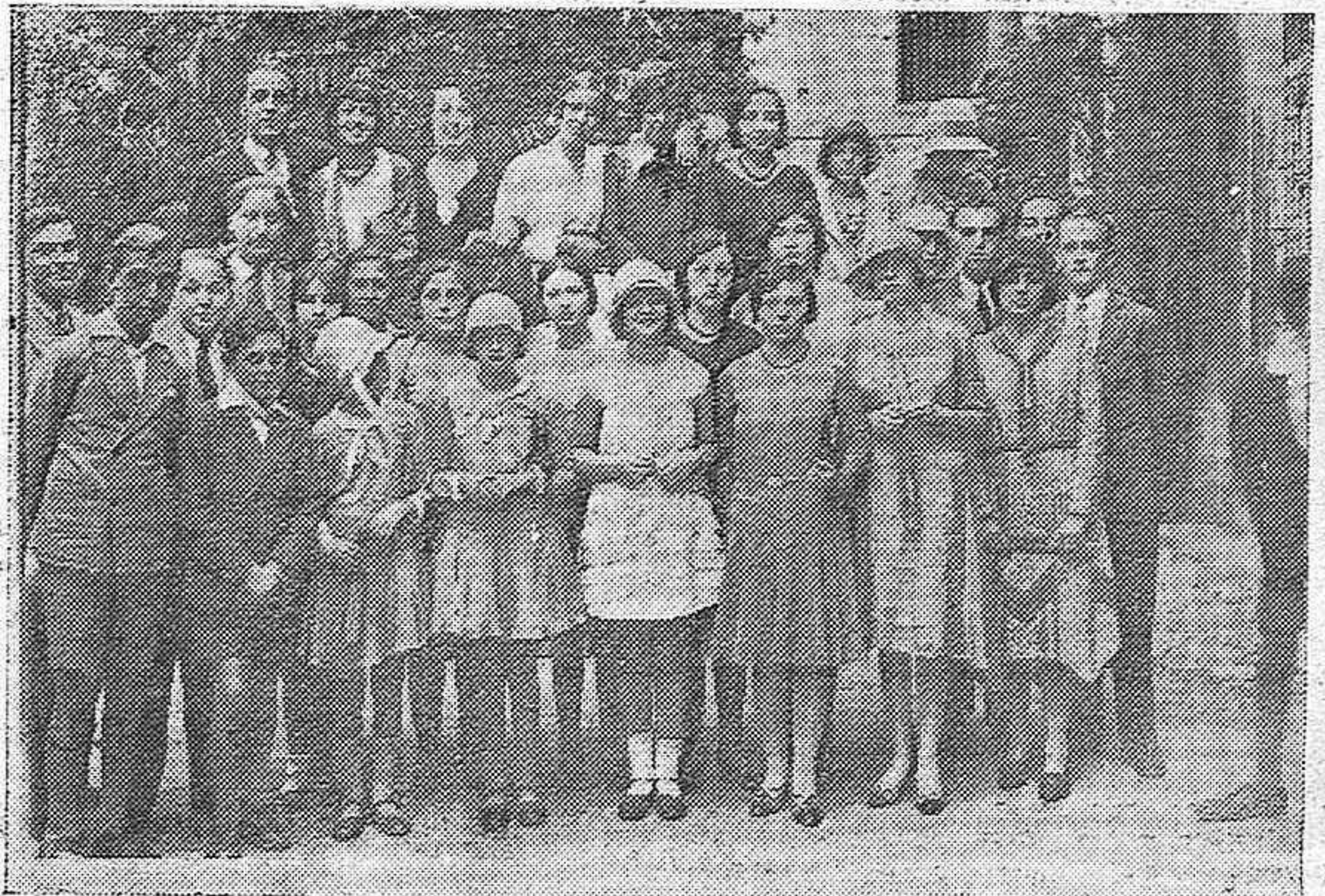
ESTUDIANTES CORDOBESSES QUE VISITARON EL MUSEO ARQUEOLOGICO EL DIA DE LA RAZA

ENCHUFE DIRECTO A LA CORRIENTE. LAMPARAS INCLUIDAS, PRECIOS: 350 Y 460 EXPOSICION: GRAN CAPITAN. 13. RENAUL. AUDICIONES: SAN FELIPE, 3. FARMACIA CANTON.