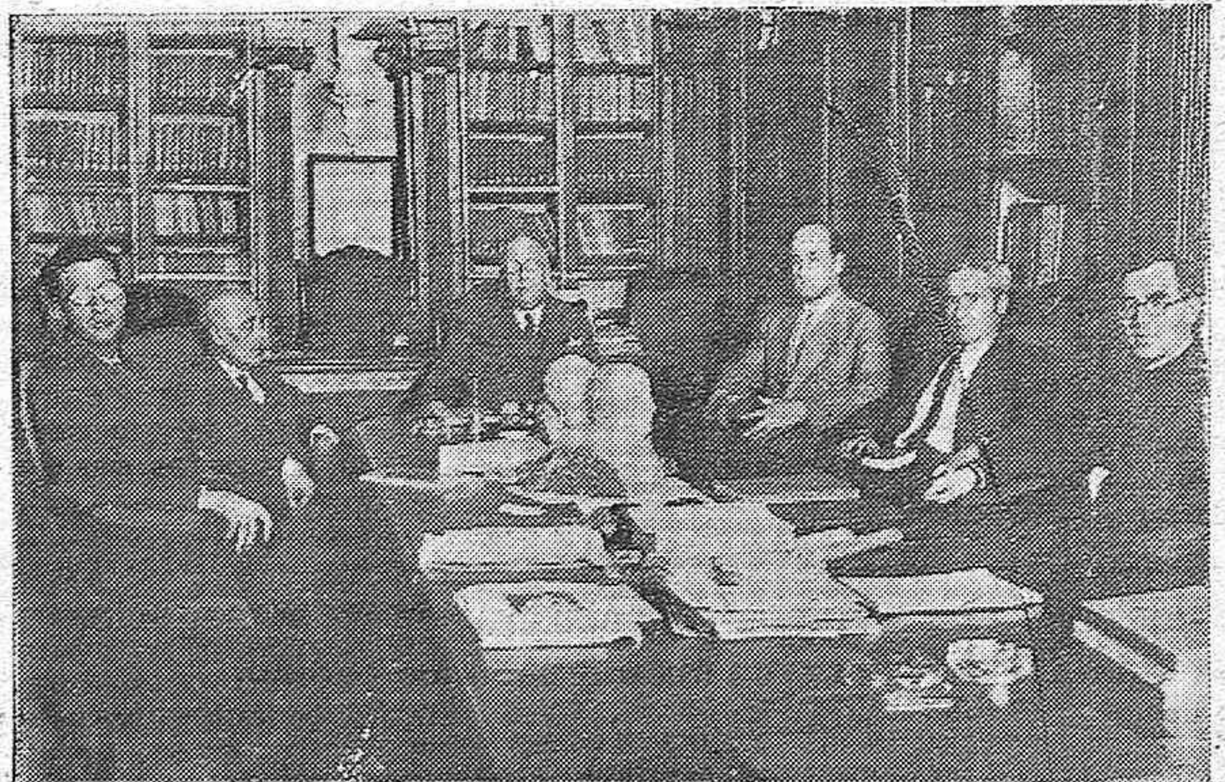
PRESIDENCIA DE LA ACADEMIA DE CIENCIAS Y BELLAS ARTES EN EL ACTO INAUGURAL DEL CURSO DE 1930-31

GANGA: Mantas de algodón desde una peseta, pañete bordado para camillas desde 1,25 pesetas metro, tapetes bordados desde 3 pesetas, en EL METRO y sus Sucursales.