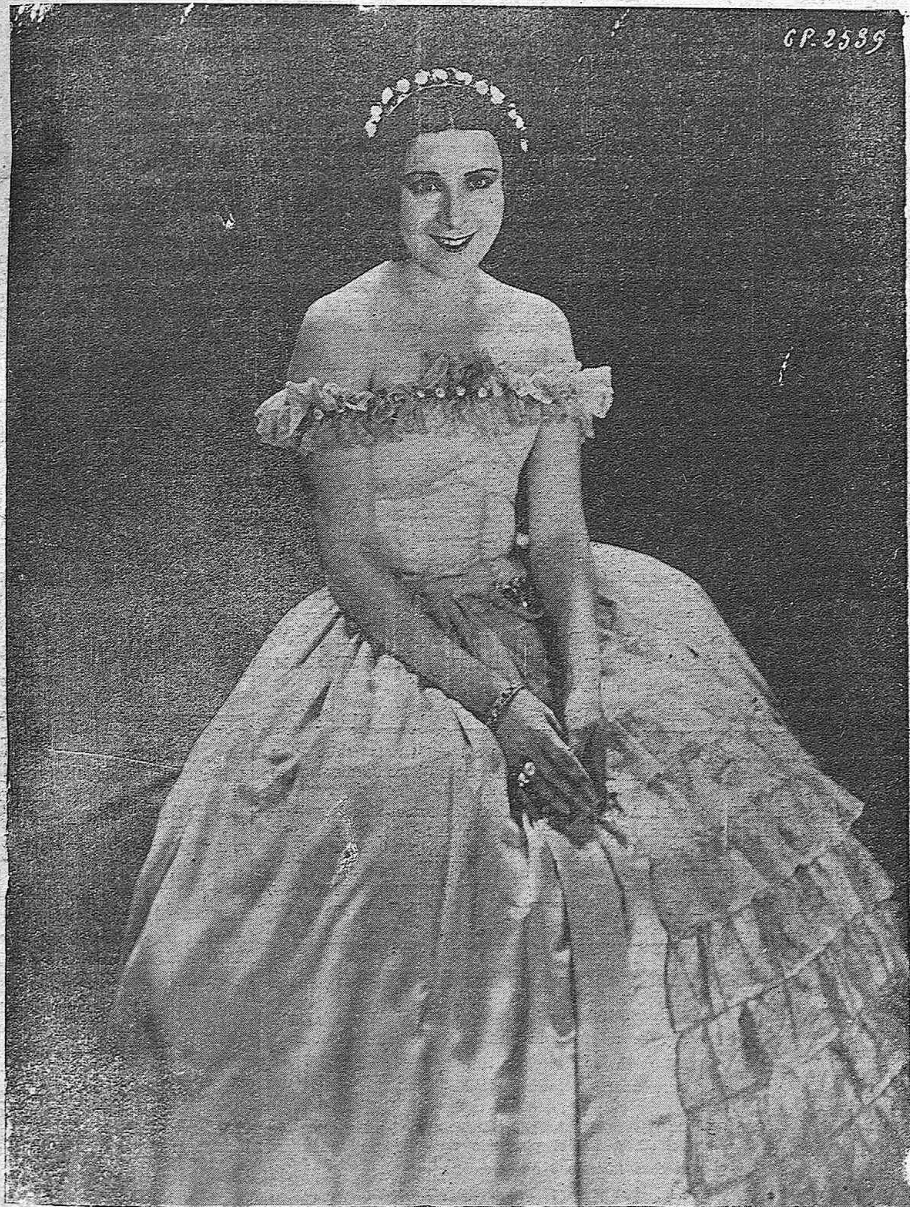
ALISTAS DE LA PANTALLA.—La popular y genial artista española Enriqueta Serrano que ha sabido destacarse como "star" cinematográfica habiendo obtenido grandes éxitos.