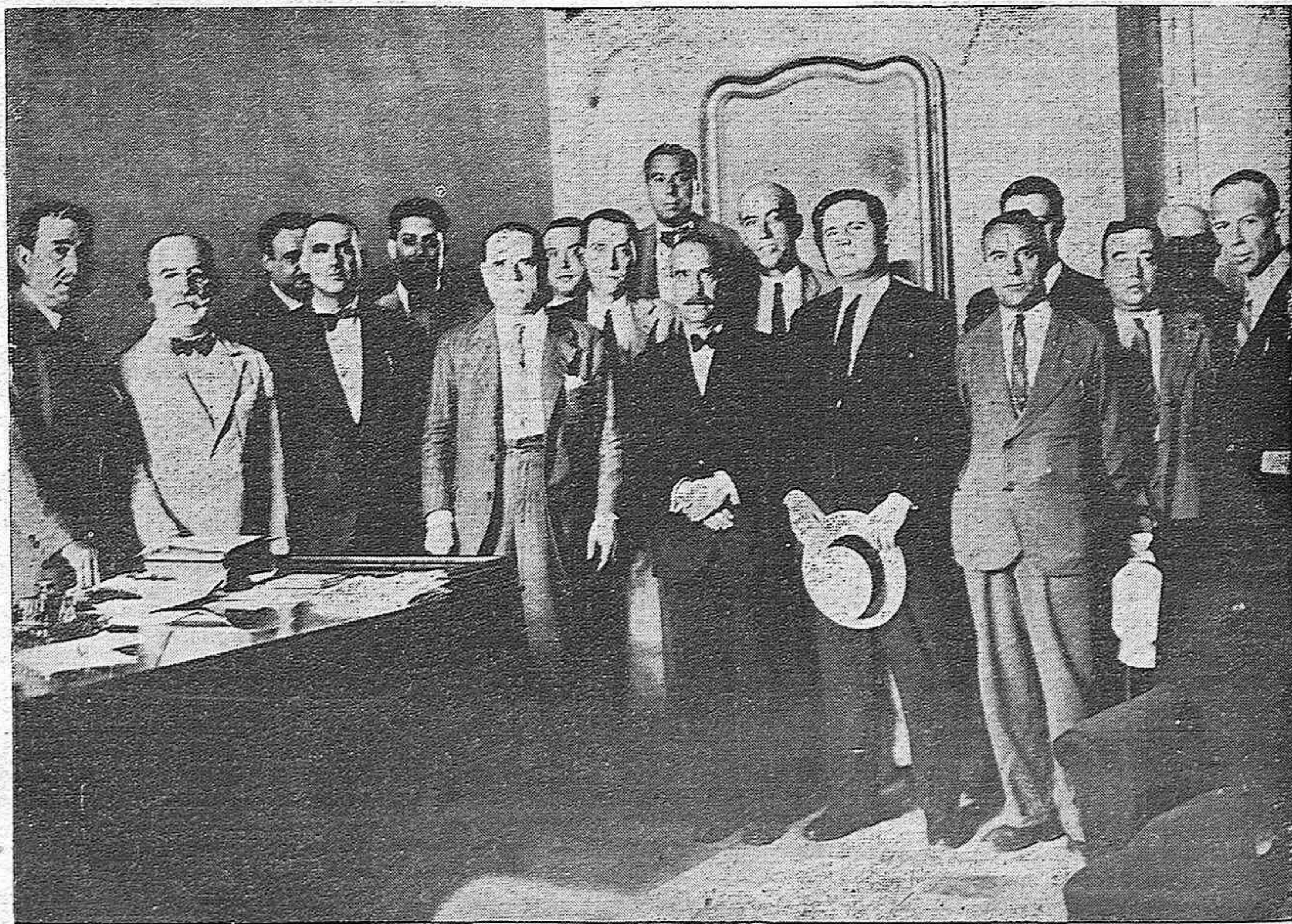
CONTRA UNA CAMPANA DIFAMATORIA.—Grupo de concejales de nuestro Ayuntamiento que acudieron a protesta ante el gobernador civil, de la campaña de difamación contra las autoridades del periódico "Política".

Ingresó en los calabozos de la Comisaría a disposición del juzgado correspondiente.