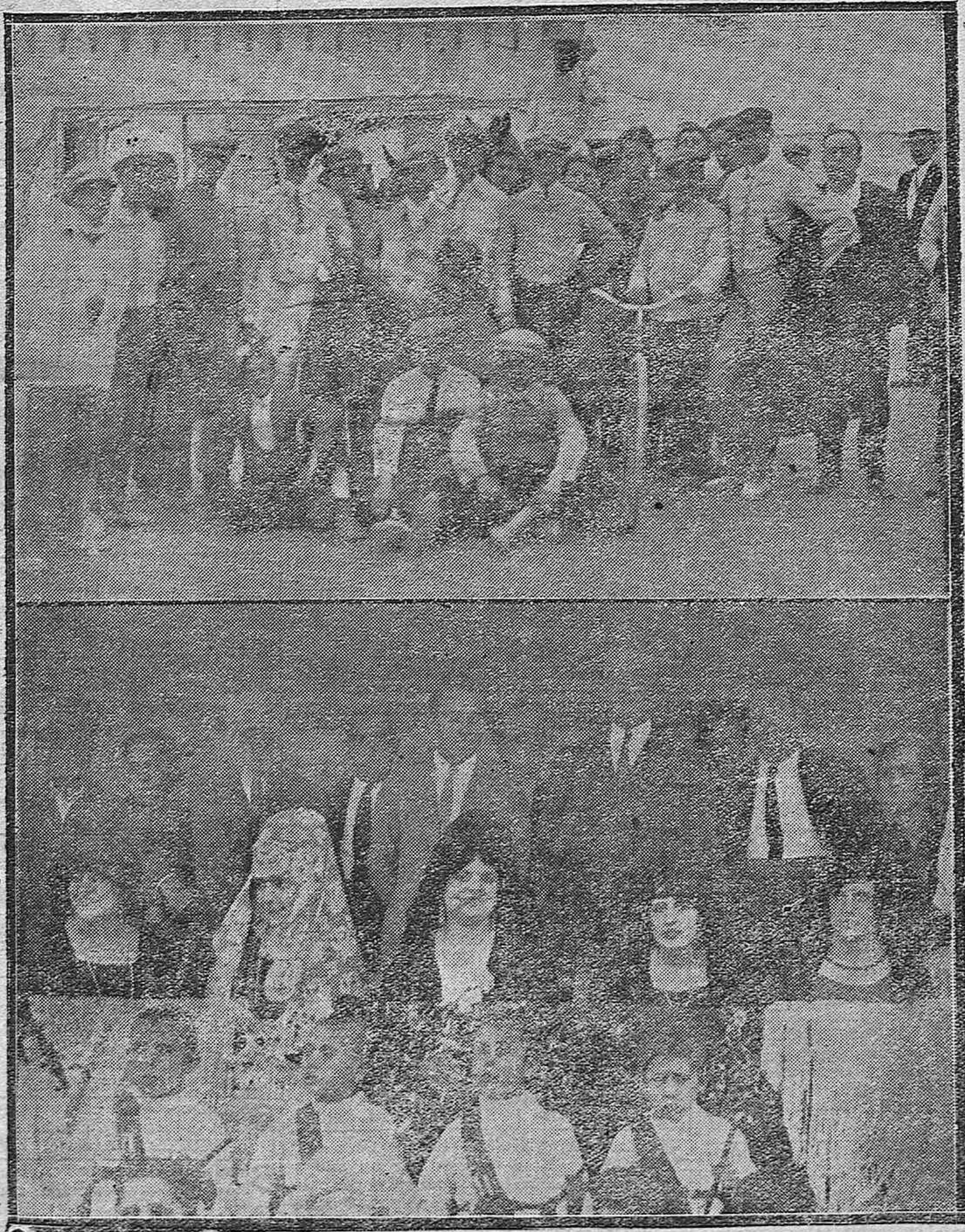
Empleados de la Electro-Mecánica que tomaron parte en la becerrada benéfica del domingo.- Distinguidas damas y señoritas que presidieron el festejo