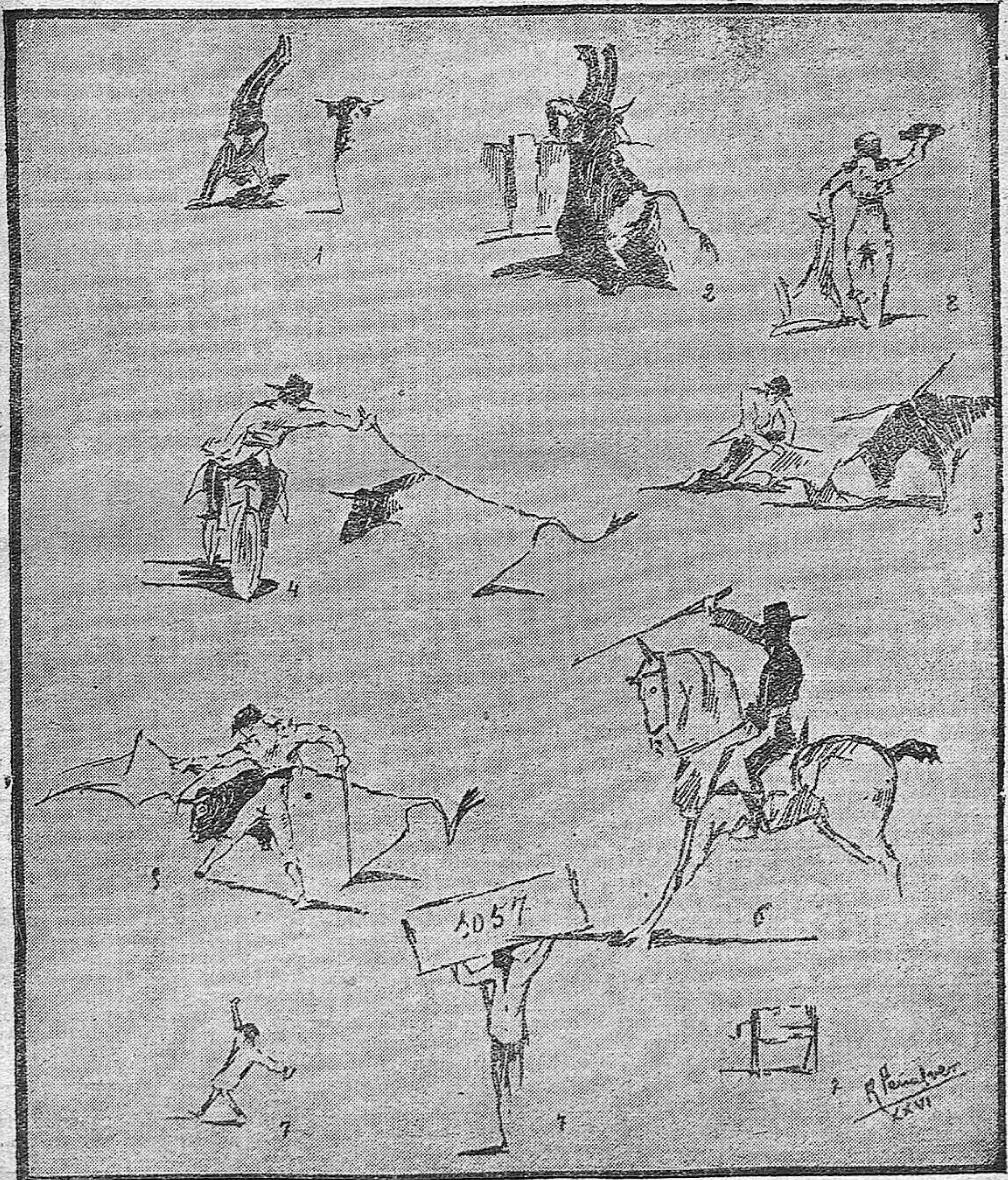
LA ULTIMA NOCTURNA.---1, 2 y 3) El Chispá en varios momentos.--4) Charlotimitando a Cañero en bicicleta.---5) Un natural de Ojeda.---6) La jaca de Florentino.---7) Lo mejor de los toros.--8) Guerrilla recogiendo las únicas ovaciones que se dieron. (Apuntes al natural por Rafael Peñalver.)