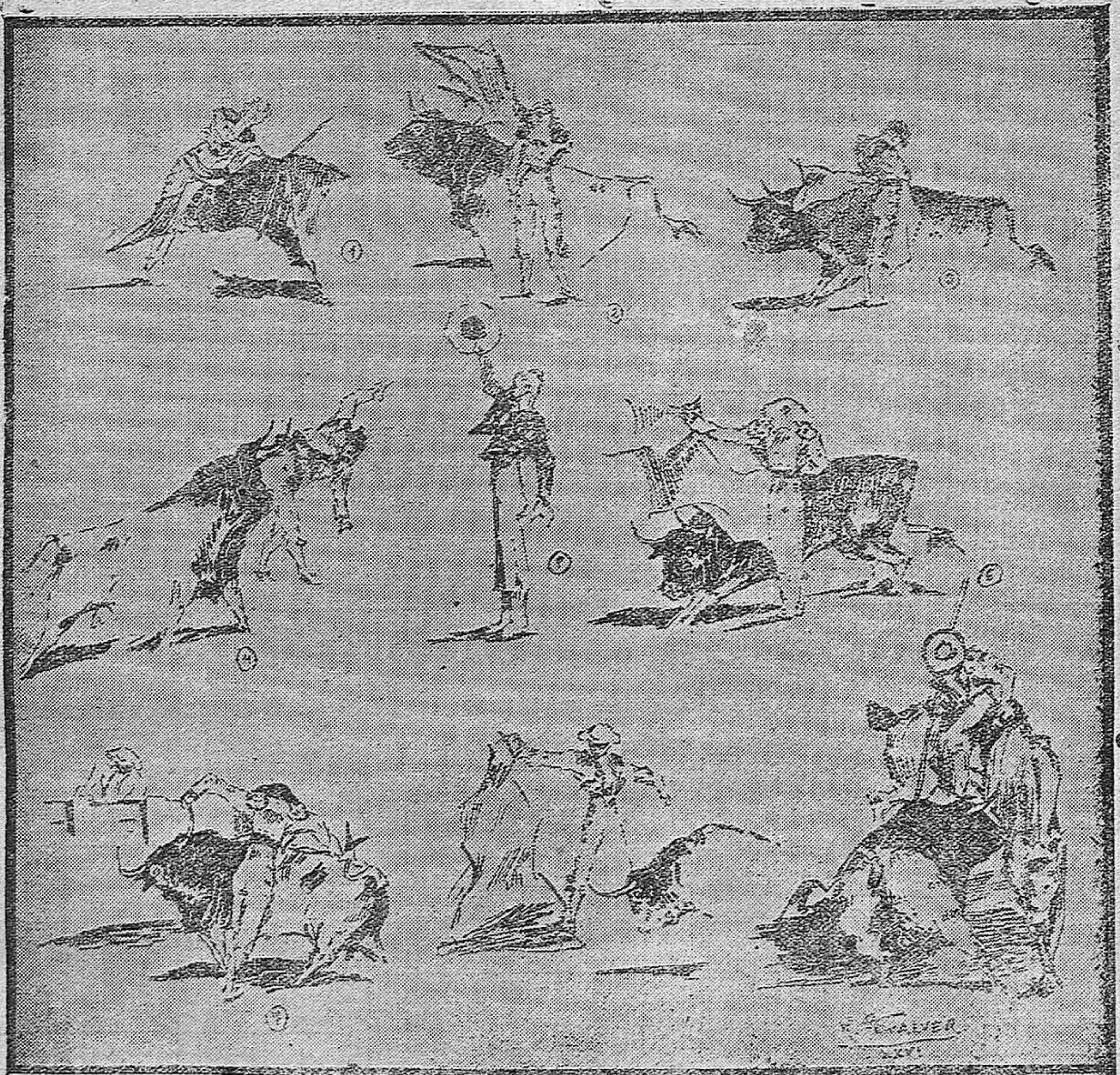
1, 2, 3) Cantimplas en varios momentos.--4) Cogida de Flores.--5) Zurito despues de un gran puyazo recoge una gran ovacion.--6, 7) Camará II en un quite templadísimo y otro emocionante.--Virutas corriendo suavemente al segundo.--Un buen puyazo de Cocherito. (Apuntes al natural por Rafael Peñalver.)