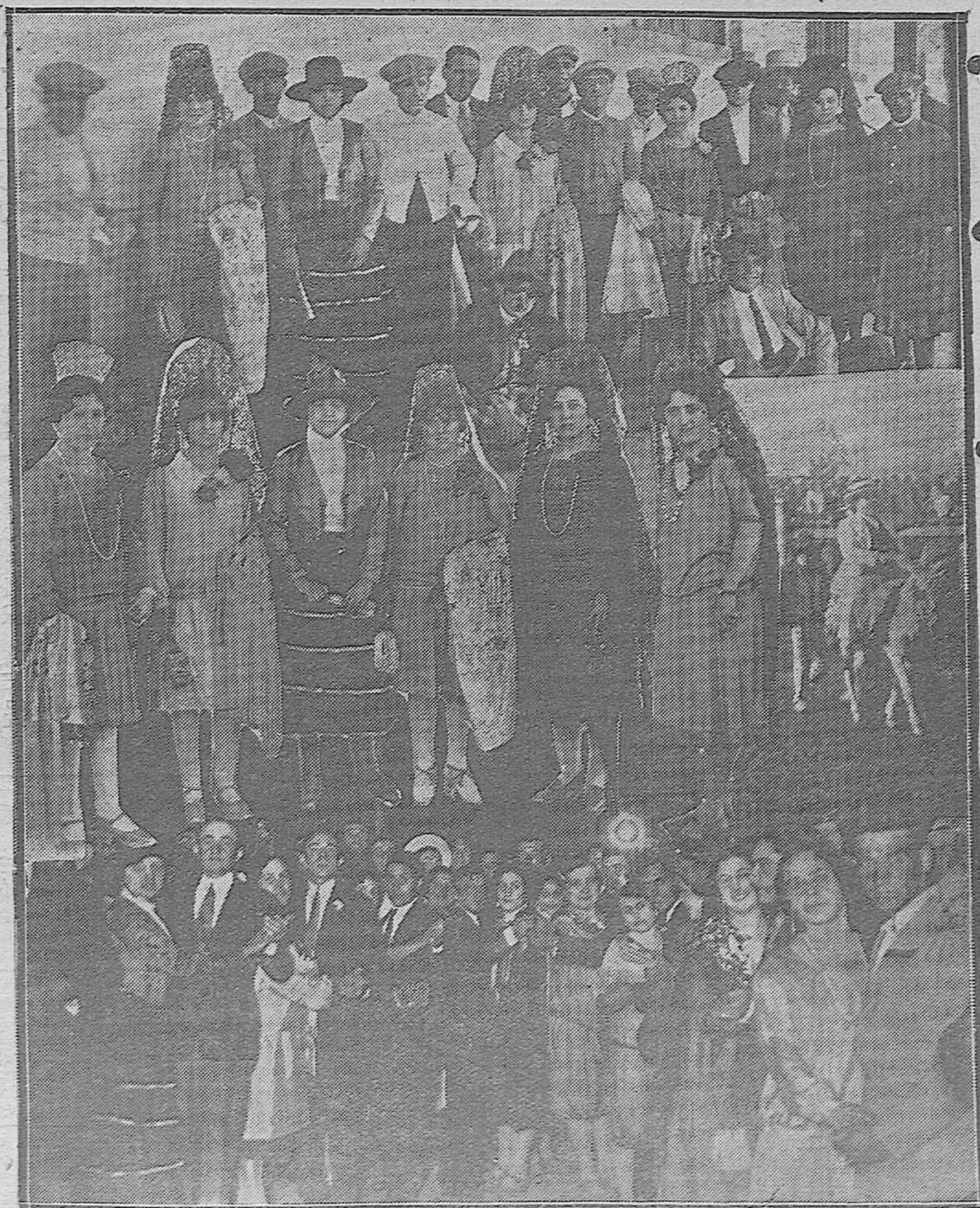
EN PUENTE GENIL.—Festival a beneficio del Colegio de Huérfanos Ferroviarios.—Bellas señoritas que presidieron la corrida.—Interesante grupo con los matadores, ferroviarios aficionados.—Los que pidieron la llave.—Una verbena que obtuvo gran éxito.