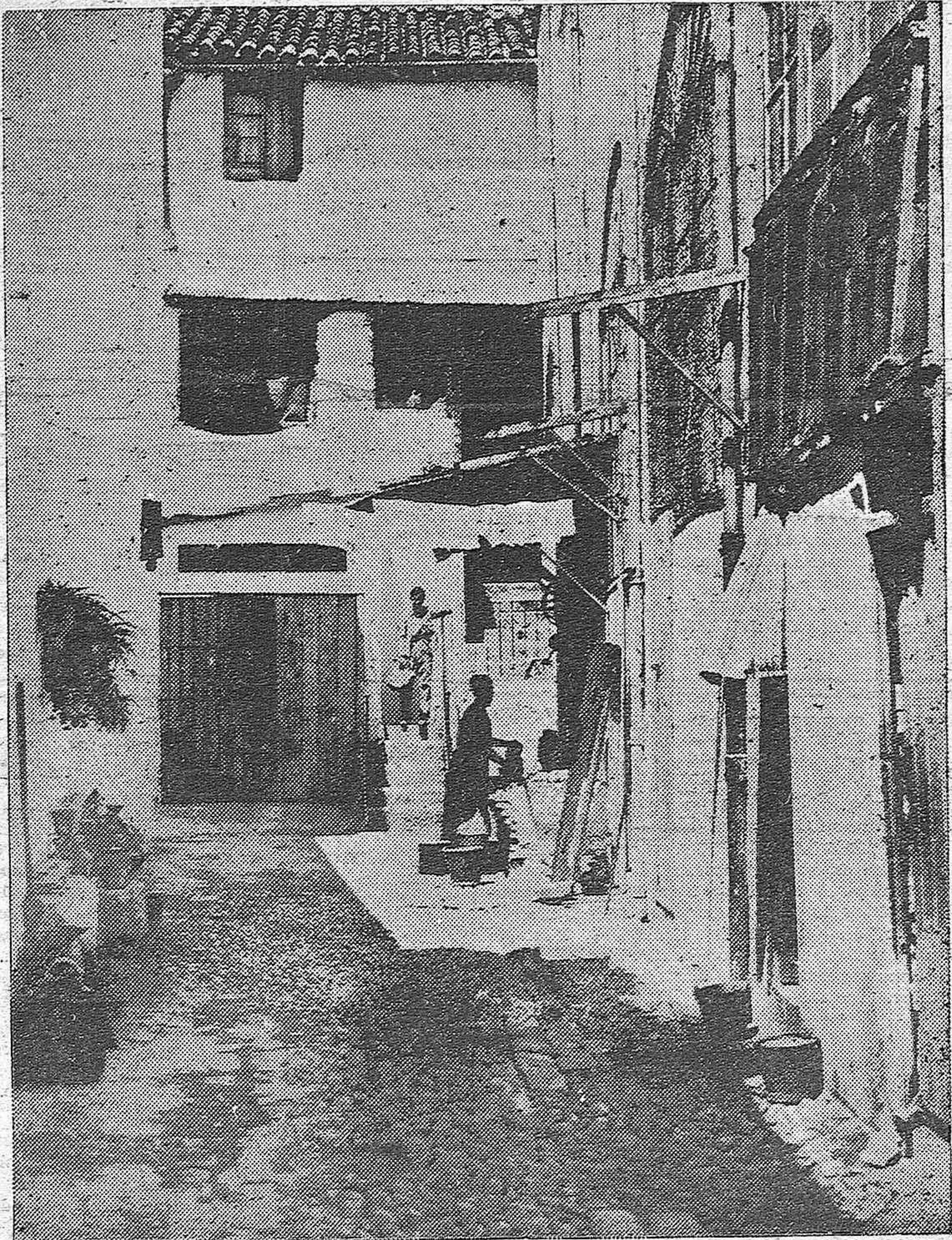
EL PROBLEMA DE LA VIVIENDA.—Callejón de entrad. a la casa de vecinos llamada del Baratillo, en la Corredera baja. La alegría que parece emanar del típico patinillo oculta el vivir negro y d amática de muchas criaturas de lo que nos ocupamos en nuestro reportaje de mañana.