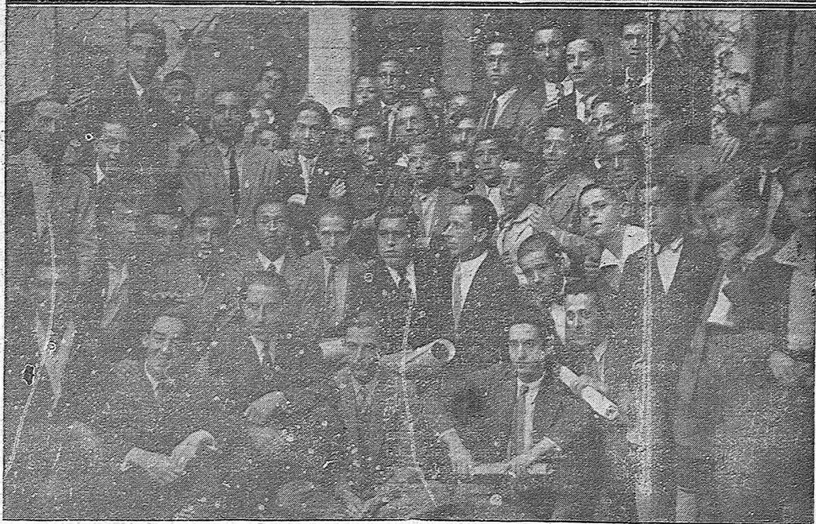
LA INAUGURACION DEL CURSO EN LAS ESCUELAS SUPERIOR Y ELEMENTAL DEL TRABAJO.—Autoridades que presidieron el acto, acompañadas de los señores del Patronato y profesores de la Escuela.—Los alumnos que obtuvieron premios especiales y los beneficiarios de las becas concedidas en el anterior curso.