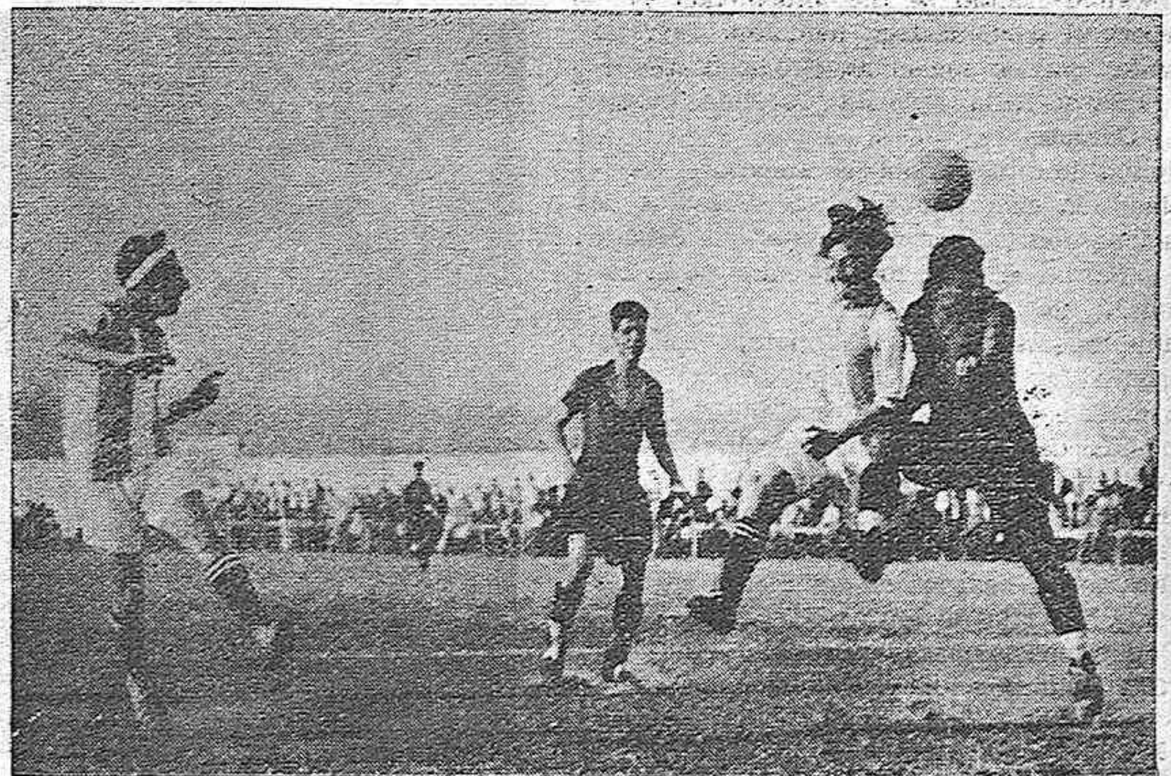
Un momento del interesante partido de balompé con que inauguró brillantemente la temporada el equipo local Córdoba Racing.

Los muchachos de la Balompédica supieron defenderse admirablemente y perder con ese honor de la superioridad física ante la superioridad de energías y técnicas futbolísticas. Los bravos muchachos rojinegros tienen un alto concepto deportivo y