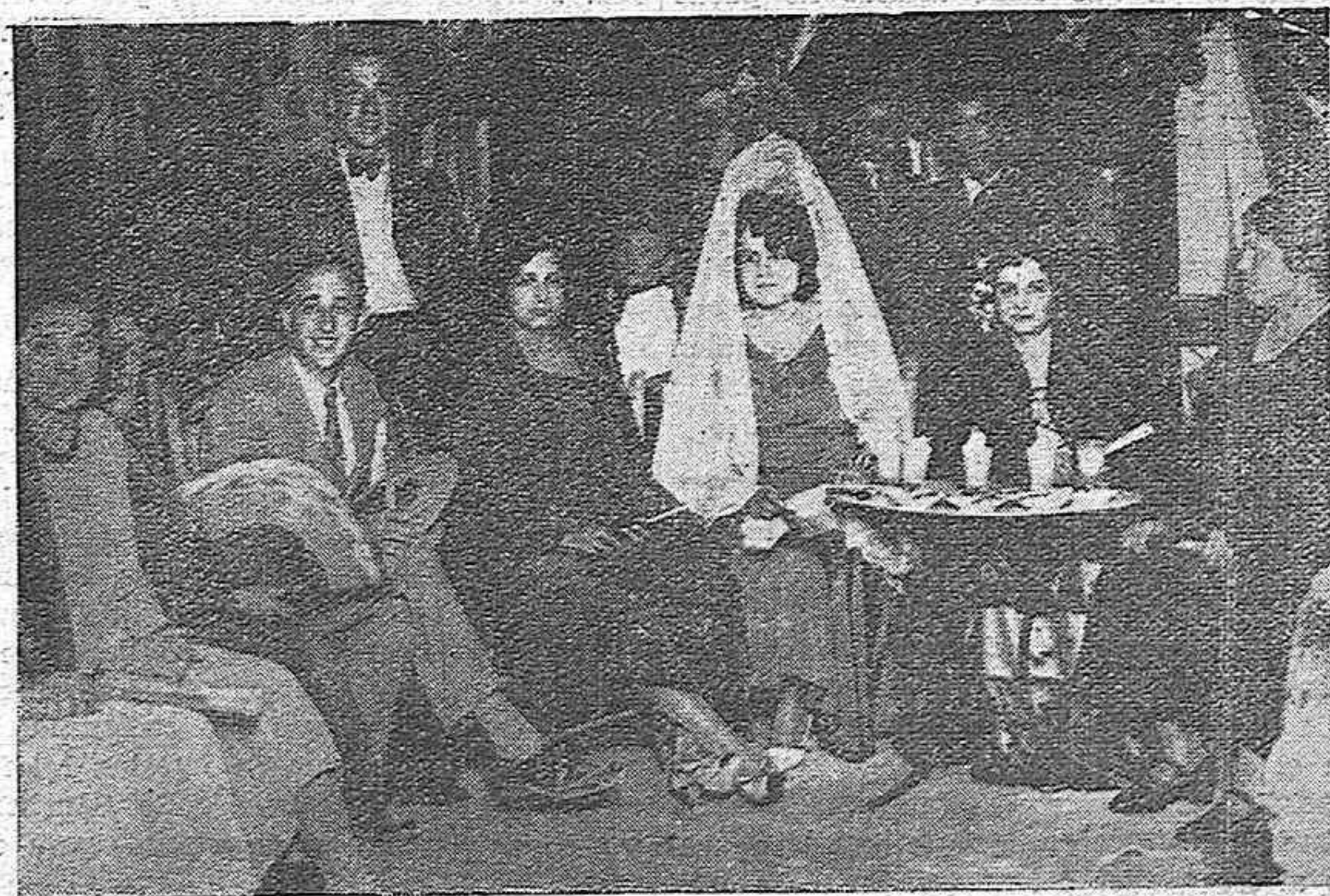
Grupo de bellas concurrentes a la caseta del Casino Republicano, instalada en la plaza de la República