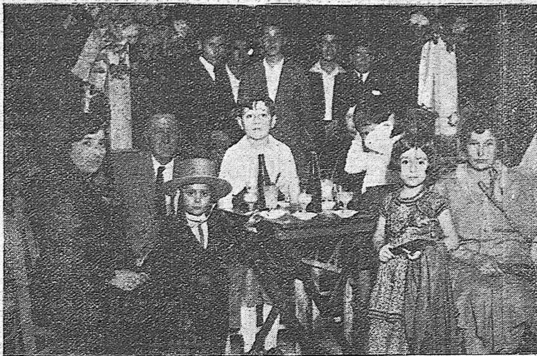
Un rincón familiar de una caseta de la feria.

¿Y el baile de la Caseta del Ayuntamiento? Imagínate un pedazo de Edén, iluminado con profusión de luces, de miles colores; arcos triunfales, verdaderas hogue-