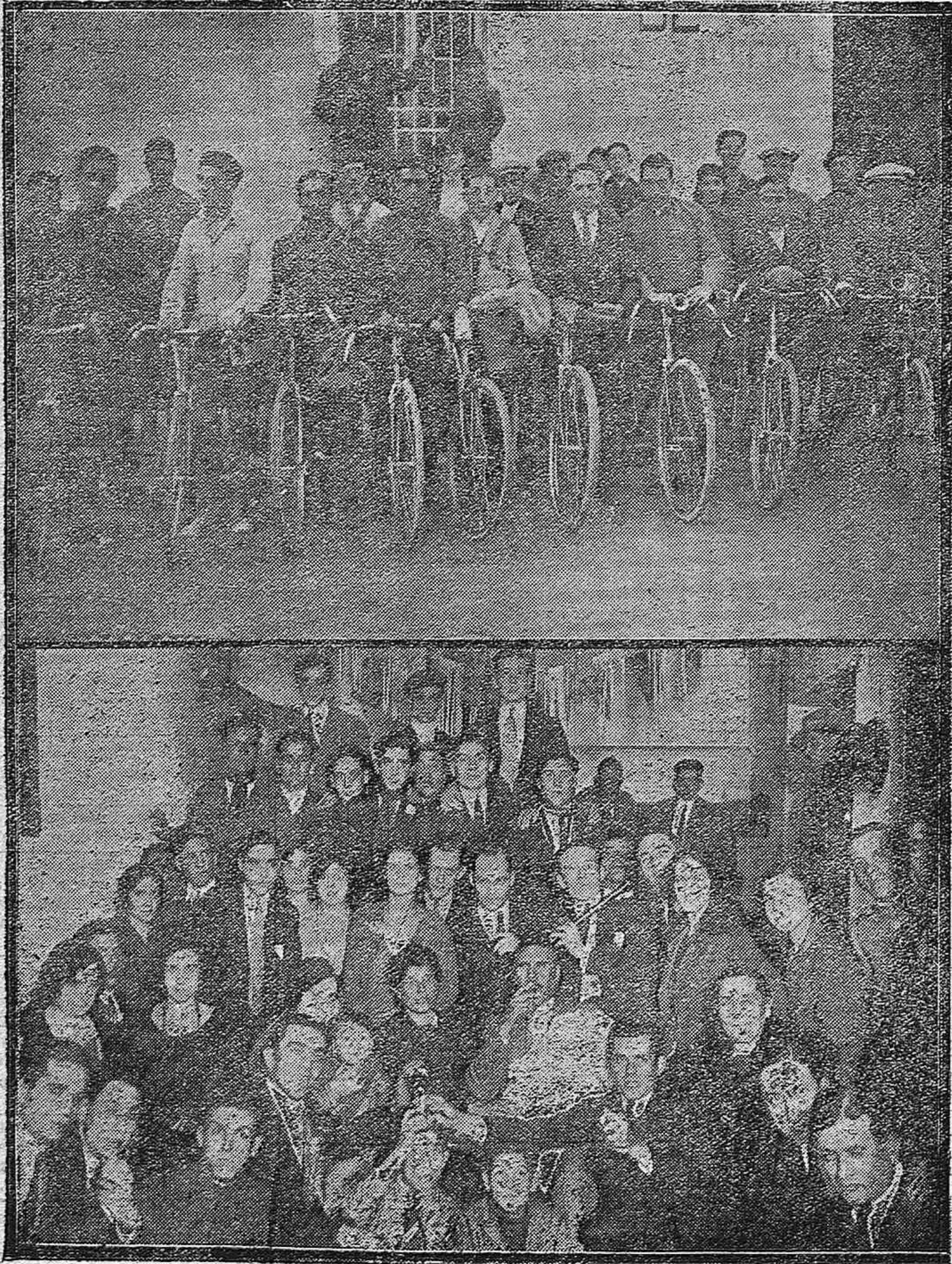
Excursión de la «Unión Velocípédica» al Cerro Muriano: salida de los corredores.— Verbena en «El Figaro Cordobés».