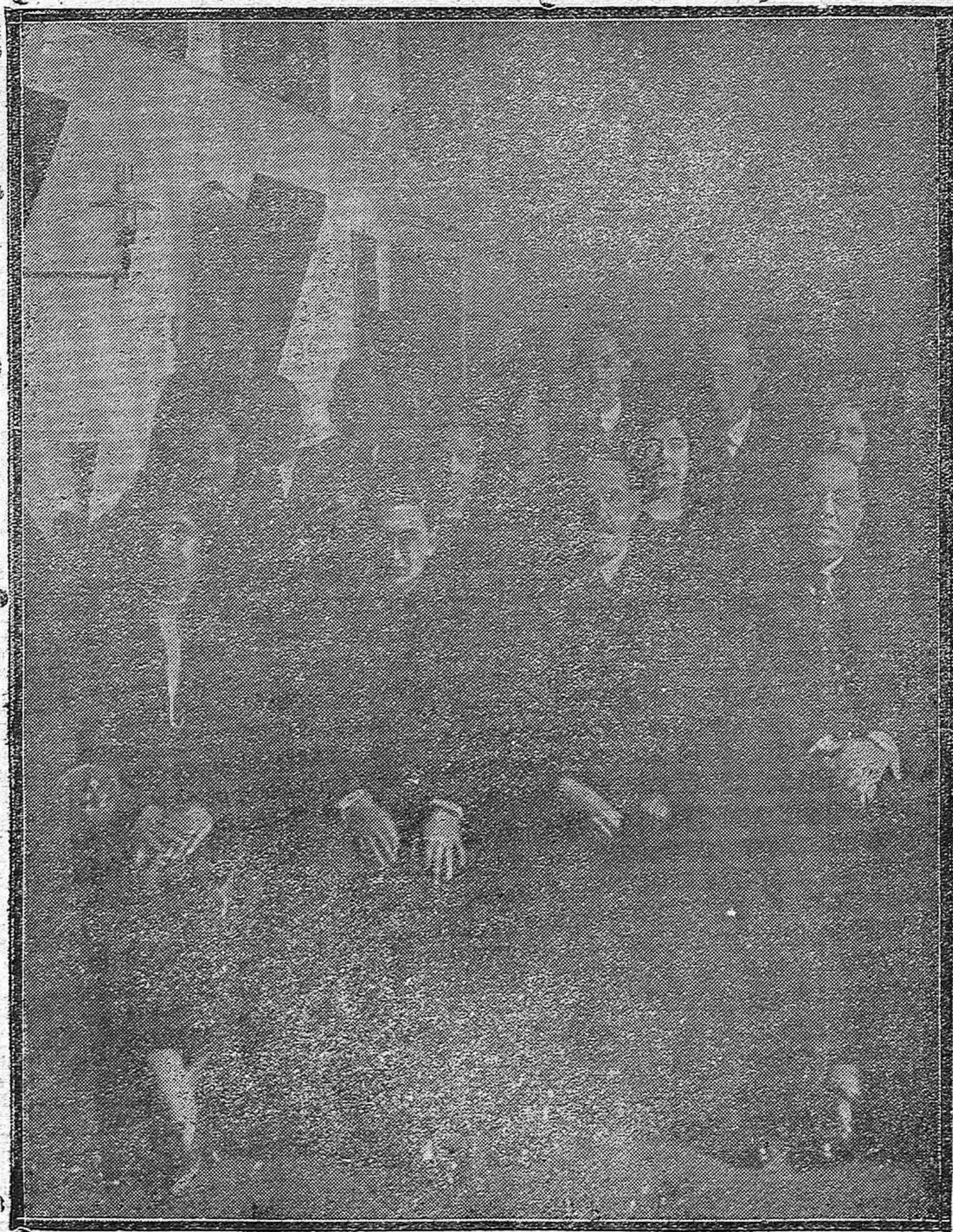
Grupo de concurrentes a la solemnidad religiosa que el Magisterio cordobés celebra anualmente en la iglesia del Juramento, en honor de San Rafael.