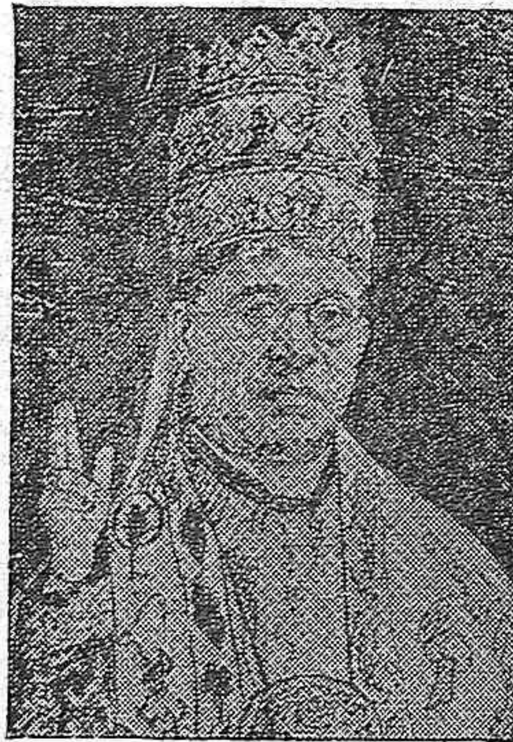
S. S. EL PAPA PÍO XI, INTELIGENCIA CLARÍSIMA Y GRAN CORAZÓN, QUE A FUERZA DE COMPRENSIÓN Y DE TACTO, HA LLEVADO A FELIZ TÉRMINO LA RECONCILIACIÓN DEL ESTADO ITALIANO CON EL VATICANO.

Ganga: Medias para señora, desde 25 céntimos, camisetas señora desde 1.25, refajo-punto desde 2.50, medias seda desde 1 peseta en El Metro y sus Sucursales.