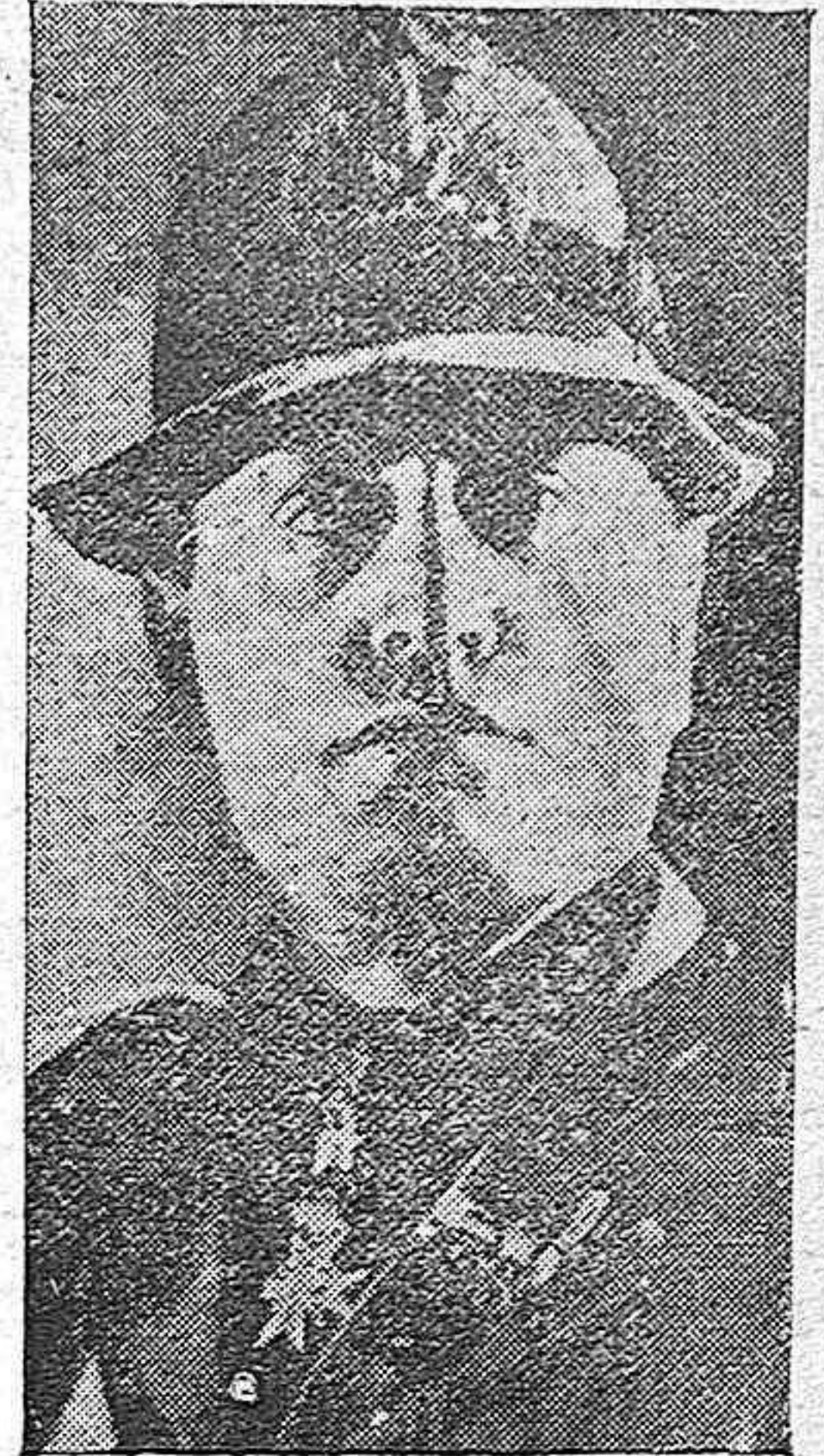
BENITO MUSSOLINI, PRIMER MINISTRO ITALIANO; DICTADOR DEL FASCIO, QUE HA DADO TODO GÉNERO DE FACILIDADES PARA LA PRONTA SOLUCIÓN DEL PLEITO ESPIRITUAL Y JURÍDICO ENTRE EL QUIRINAL Y EL VATICANO.

Ganga: Medias para señora, desde 25 céntimos, camisetas señora desde 1.25, refajo-punto desde 2.50, medias seda desde 1 peseta en El Metro y sus Sucursales.