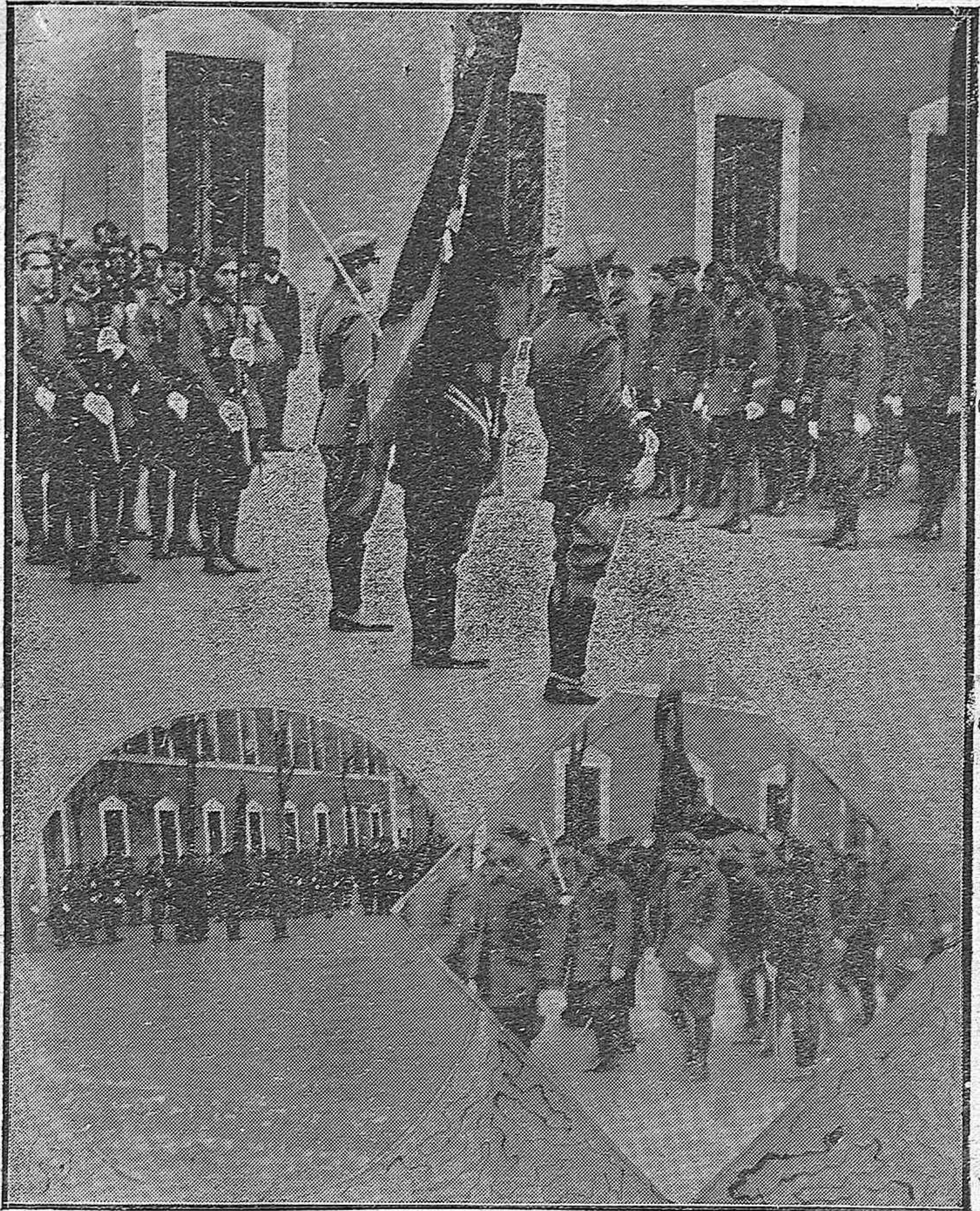
LA JURA DE LA BANDERA POR LOS RECLUTAS DEL CAPITULO XX.—Un momento de la ceremonia.—Los nuevos reclutas del Regimiento de la Reina prestando juramento.—Desfile bajo la Bandera