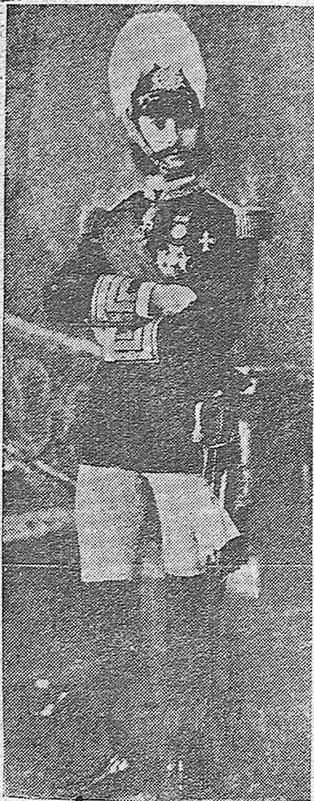
S. M. EL REY DON ALFONSO XII ESPOSO DE DOÑA MARÍA CRISTINA, POCO ANTES DE SU FALLECIMIENTO. OCURRIDO EN NOVIEMBRE DE 1885.

Con motivo de la guerra de Cuba, hizo falta dinero en oro para el sostenimiento de nuestra escuadra en las colonias, pues los billetes no tenían circulación, por estar depreciados. El Gobierno contaba con muy escasa cantidad. La escuadra veíase a punto de no poder salir. Enterada la Reina, llamó a su intendente general y le preguntó por la cantidad de oro que habría en caja.