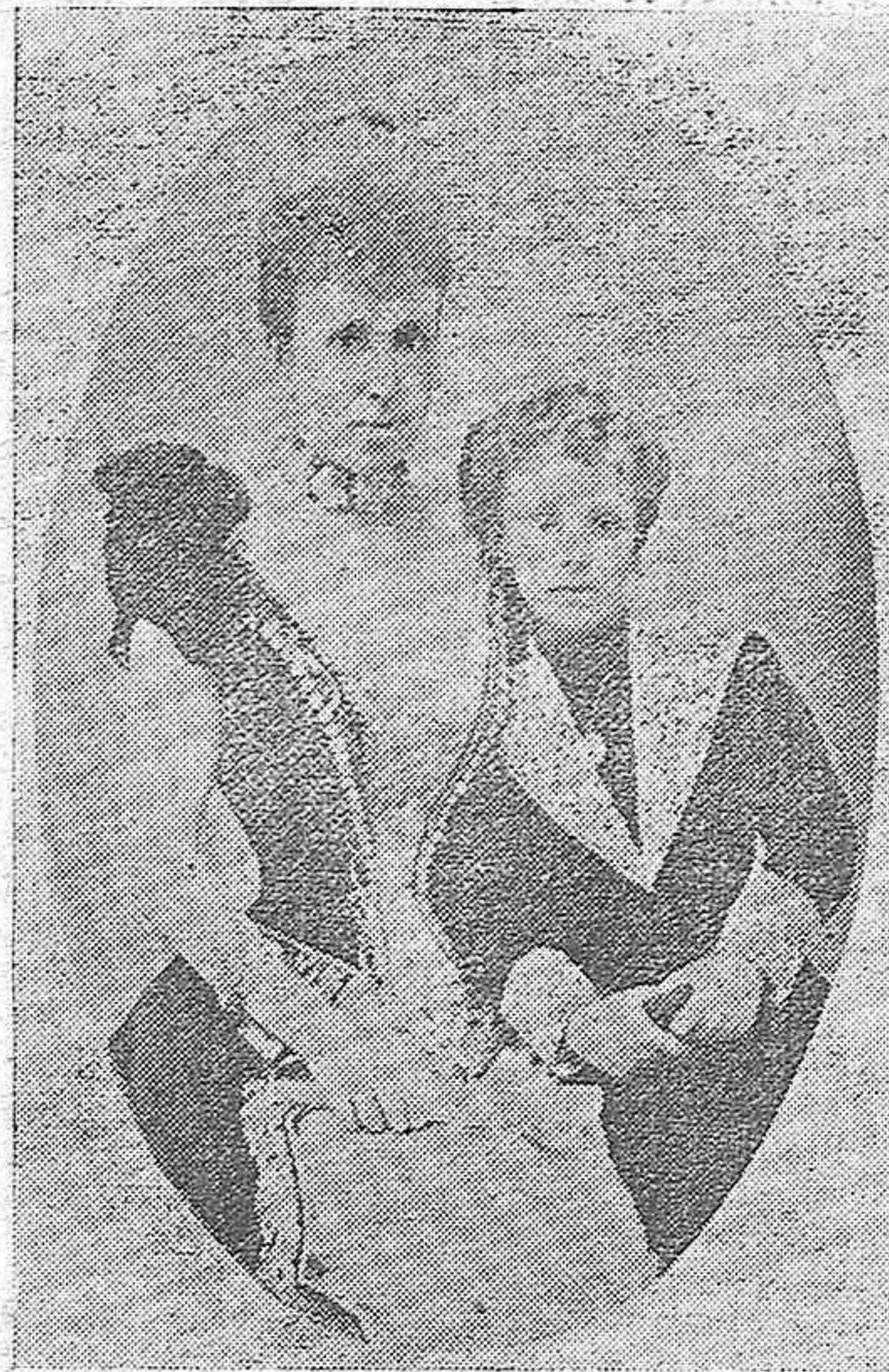
S. M. LA REINA DOÑA MARÍA CRISTINA, CON EL REY DON ALFONSO XIII AL CUMPLIR ÉSTE LOS CINCO AÑOS.

El día en que Otero atentó contra la vida del Monarca don Alfonso XII, la Reina, que le acompañaba en aquel instante, dio señales de una gran sangre fría extraordinaria, no alterándose su fisonomía, manteniendo erguida la figura, retando a la muerte.