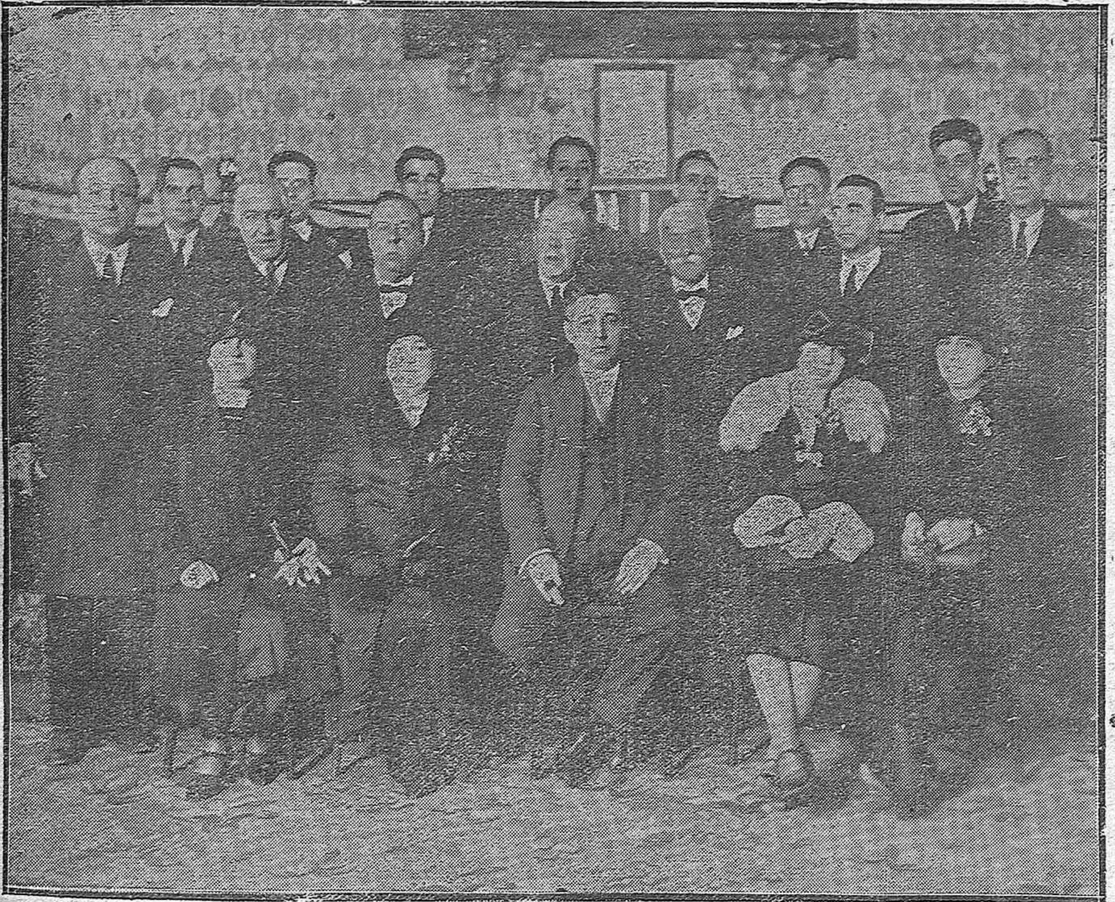
El Claustro de profesores y los nuevos profesores auxiliares de las enseñanzas costeadas por el Ayuntamiento, al terminar el acto de la posesión.