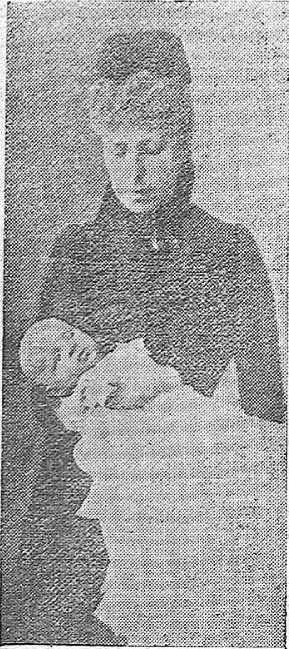
S. M. LA REINA DOÑA MARÍA CRISTINA, TENIENDO EN BRAZOS A SU HIJO DON ALFONSO CUANDO ÉSTE CONTABA CUATRO MESES.