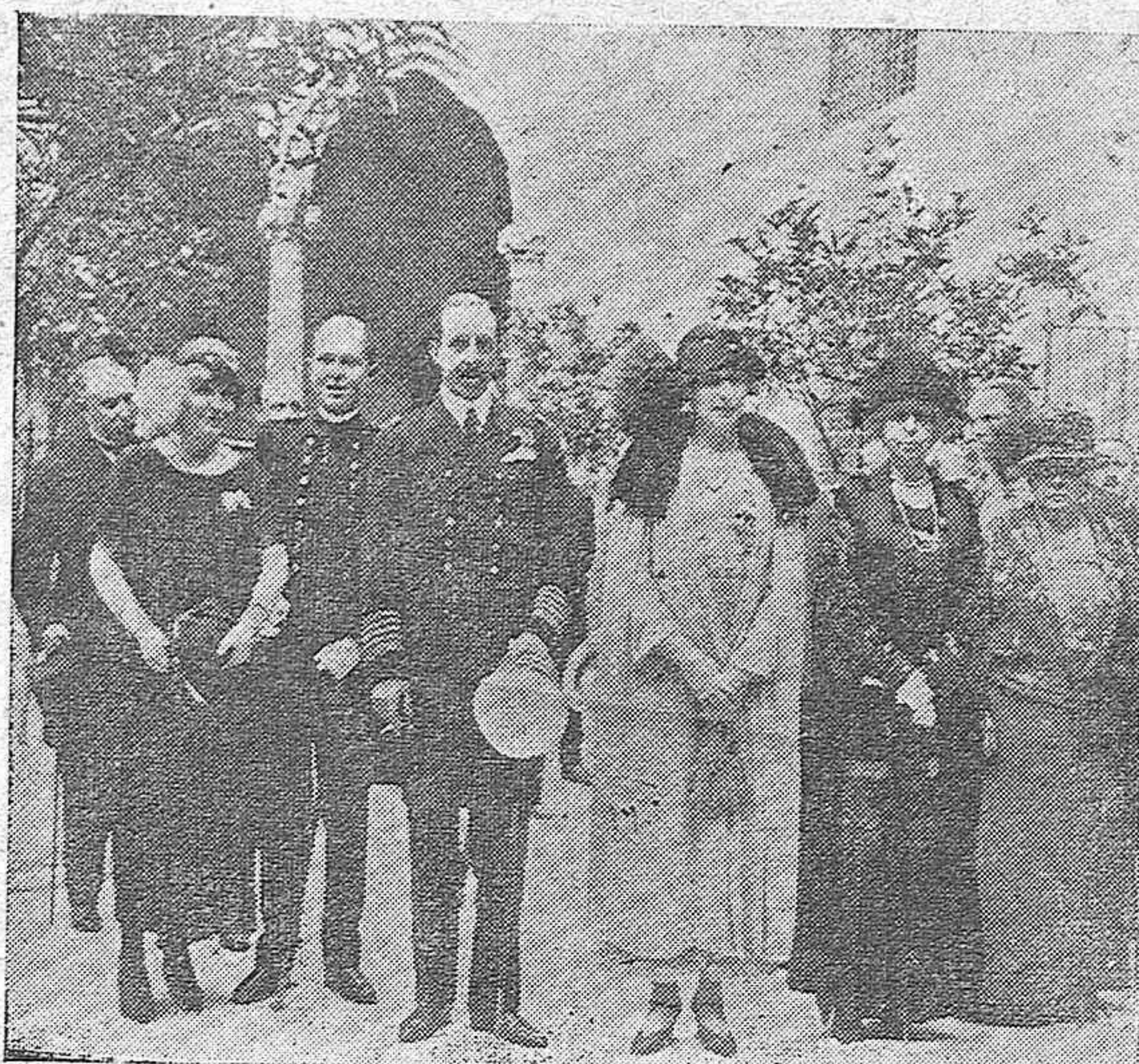
INTERESANTE Y RECIENTE GRUPO DE LOS SOBERANOS ESPAÑOLES. PRÍNCIPE HE-REDERO, DOÑA MARÍA CRISTINA E INFANTA ISABEL.

Merced a una hábil operación económica hallóse el oro necesario, no siendo preciso que la Reina sacrificase su fortuna personal; sacrificio que, voluntaria, patriótica y generosamente se había impuesto.